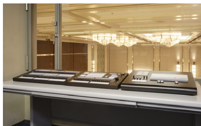
「THE HÔ(鳳凰)」調光室のパステルプレノ