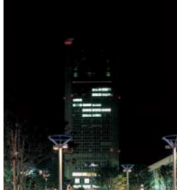
左上/A10702C-04 左中/A10702C-05 左下/A10702C-06 右/A10702C-08