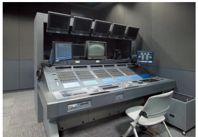
スタジオSWITCH スタジオ調光操作卓