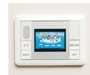
消費エネルギーを「見える化」するECOマネシステム(画面はイメージ)