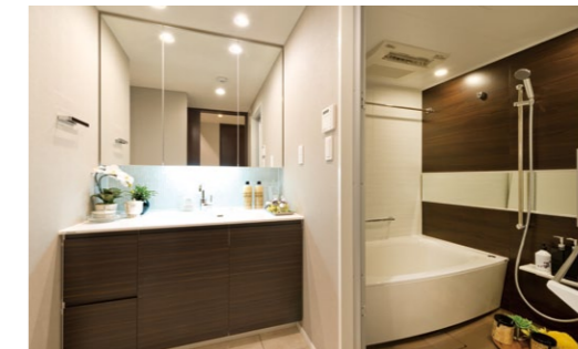
デザインコーディネートされた、i-X(イクス) DRESSINGとi-X BATHROOM