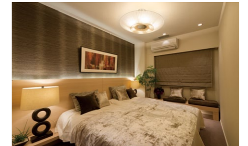
共用廊下の美観を保つため全室外機をバルコニーに設置し、各部屋のエアコンは天井裏のダクトで接続(一部事業協力者住戸除く)