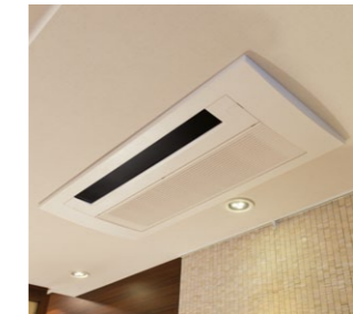
LDKの天井カセットタイプエアコン

マジェスティハウス新宿御苑パークナード 所在地／東京都新宿区大塚町 事業主／パナホーム株式会社 都市開発支社 販売提携／野村不動産アーバンネット株式会社 設計／株式会社イクス・アーク都市設計 施工／清水建設株式会社 東京支店 内装工事／パナソニックES集合住宅エンジニアリング株式会社 構造・階数／鉄筋コンクリート造 地上10階・地下1階建 総戸数／195戸(事業協力者住戸70戸含む) 竣工／2014年2月(予定)