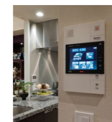
マンションHAシステム「Windea」