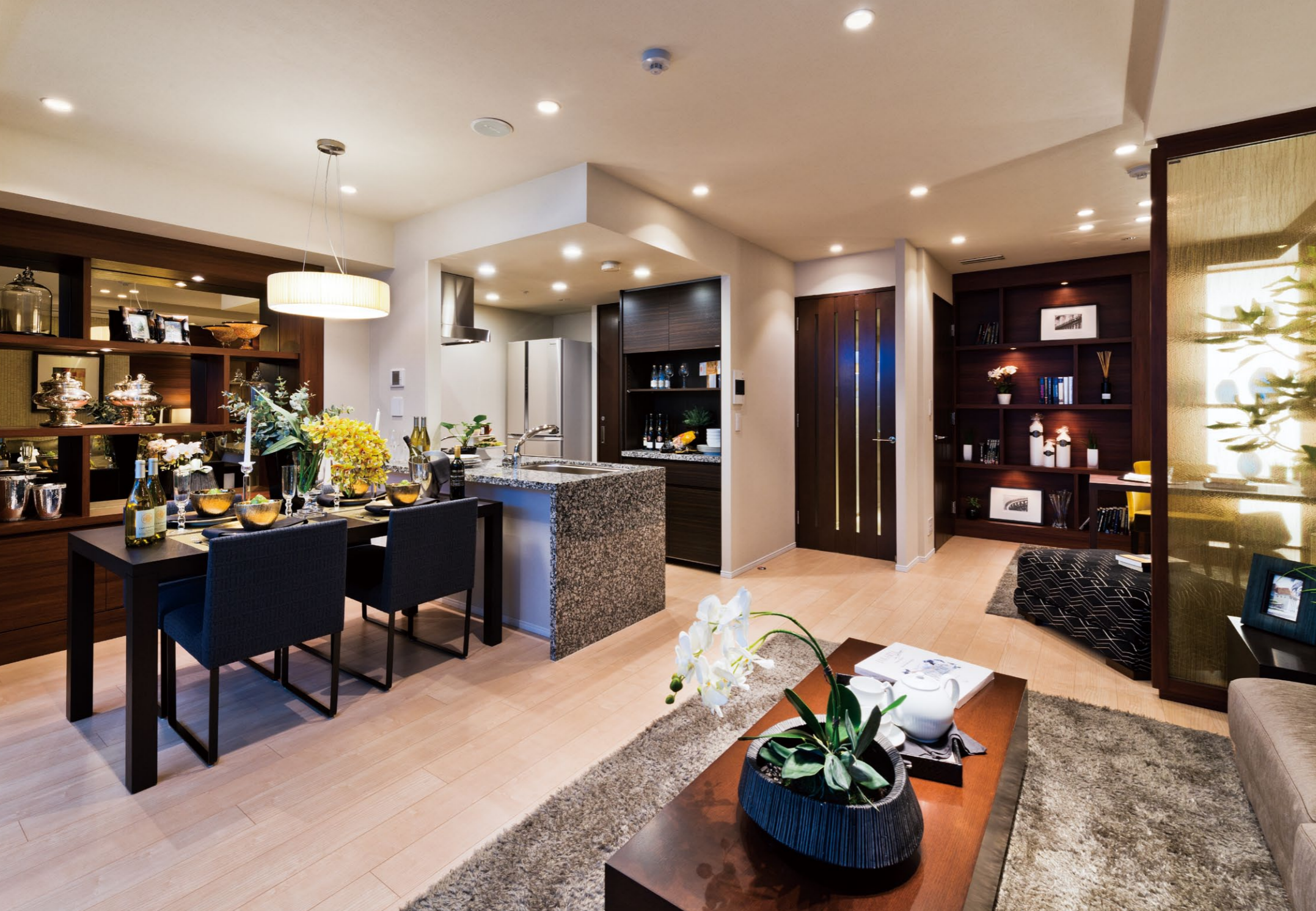
特別仕様としてLS-iシリーズのキッチンを中心に天然石カウンターが用いられ、重厚なインテリア空間が創り出されている

等価交換方式で建て替えられた トップグレードの分譲マンション 「マジェスティハウス新宿御苑パークナード」は、この地にあった、土地の権利形態が異なる3棟の分譲マンションと野口英世記念会館が等価交換方式によって建て替えられたもの。100名以上におよぶ地権者の合意のもと、約4,100m 2 超の敷地面積に、195戸を建設。全戸のうち、70戸を地権者に販売し、残りをパナホーム株式会社が一般分譲している。住戸は全43タイプのプランが用意され、一部住戸ではオーダーメイドプランを提供。プランの数は80におよび、図面数や工程管理の工数も膨大となった。このた