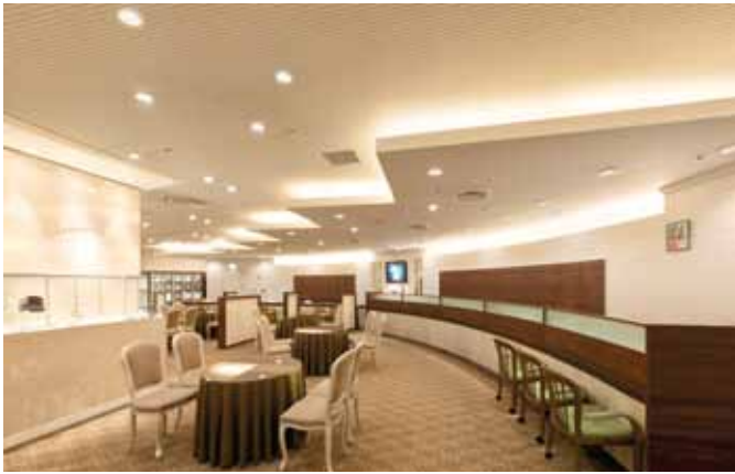
建築化照明とLEDダウンライトが落ち着いた美しさを演出する、ご相談コーナー