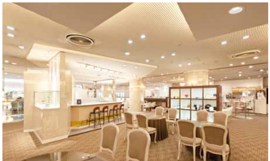
ウエディングドレスやジュエリーの展示スペース。良き日の夢がふくらむ華やかな雰囲気はLED照明が引き立てる

そこで運営費、特に光熱費の削減が重要政策に。中でも共用部の照明は点灯時間が長く効率化のメリットが大きい。ため、まずはこの部分の白熱灯約1,200台を、LED照明に切り替えることとなりました。