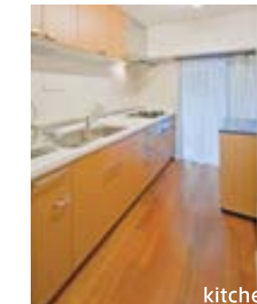
リビングステーションSを採用。天井を高くし、開放感を演出