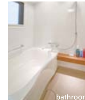
半身浴が楽しめるリノーヴァWタイプ