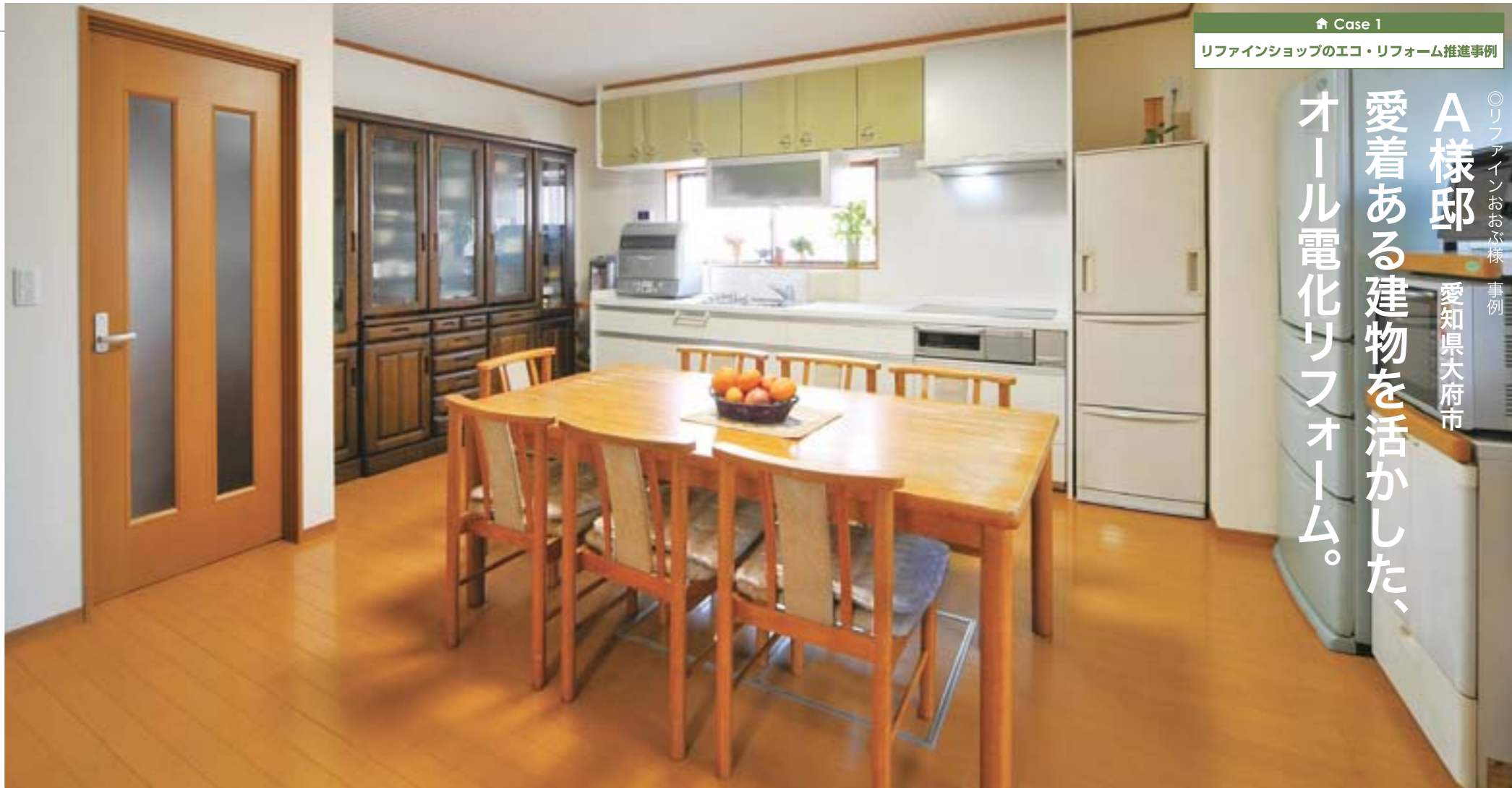
Case 1 リファインショップのエコ・リフォーム推進事例

◎リファインおおぶ様 事例 愛知県大府市 A様邸 愛着ある建物を活かした、 オール電化リフォーム。