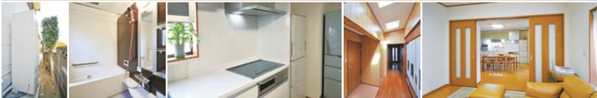
エコキュートの導入 バスルームにはi-Uを採用 キッチンにはお手入れしやすいリビングステーション トイレ前の廊下には天窓を採用 引戸を開けるとリビングと一体になった広い空間に

「リファインおおぶ」様は、今回のリフォームで国の補助金 (NEDO) を受けられるように申請のお手伝いをされました。補助金を利用する場合、申請が通るまで工事着工できません。また、リフォーム後も3年間電力消費データを取るなど、施主様のご理解も必要です。しかし、そのデータ取りがお客様のエコに対する関心を高めることになり、今ではムダのないエネルギー使用を日頃から心がけておられるとか。補助金の活用には、施主様との信頼関係が欠かせないようです。