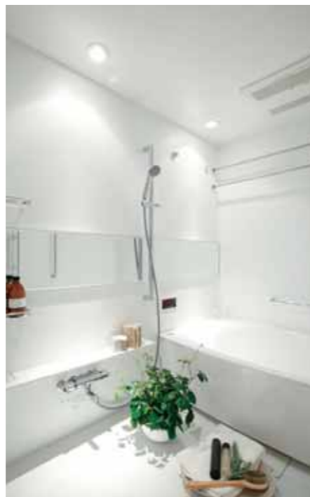
ダウンライトでデザイン性が際立つバスルームi-X