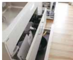
開閉がラクな大容量のキッチン収納