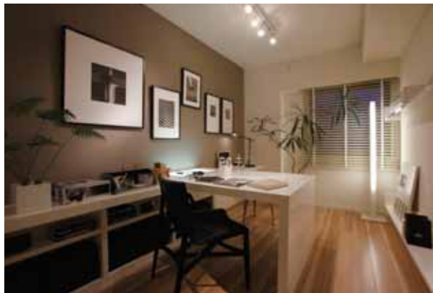
趣味や子供の勉強部屋にも使えるマルチユースのワークスペース