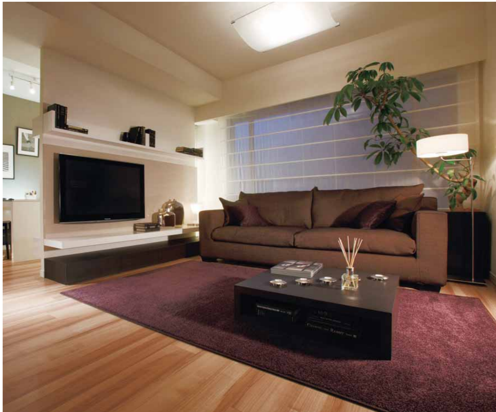
薄型テレビと半分間仕切り壁が一体となって仕切られたリビングとワークスペース (左)