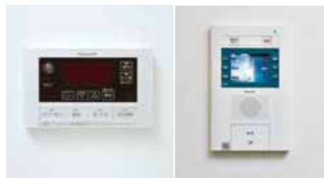
コミュニケーションリモコン(左)と住宅情報盤(右)