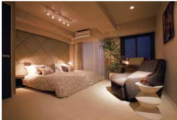
貴重な時間を楽しめるよう演出された主寝室