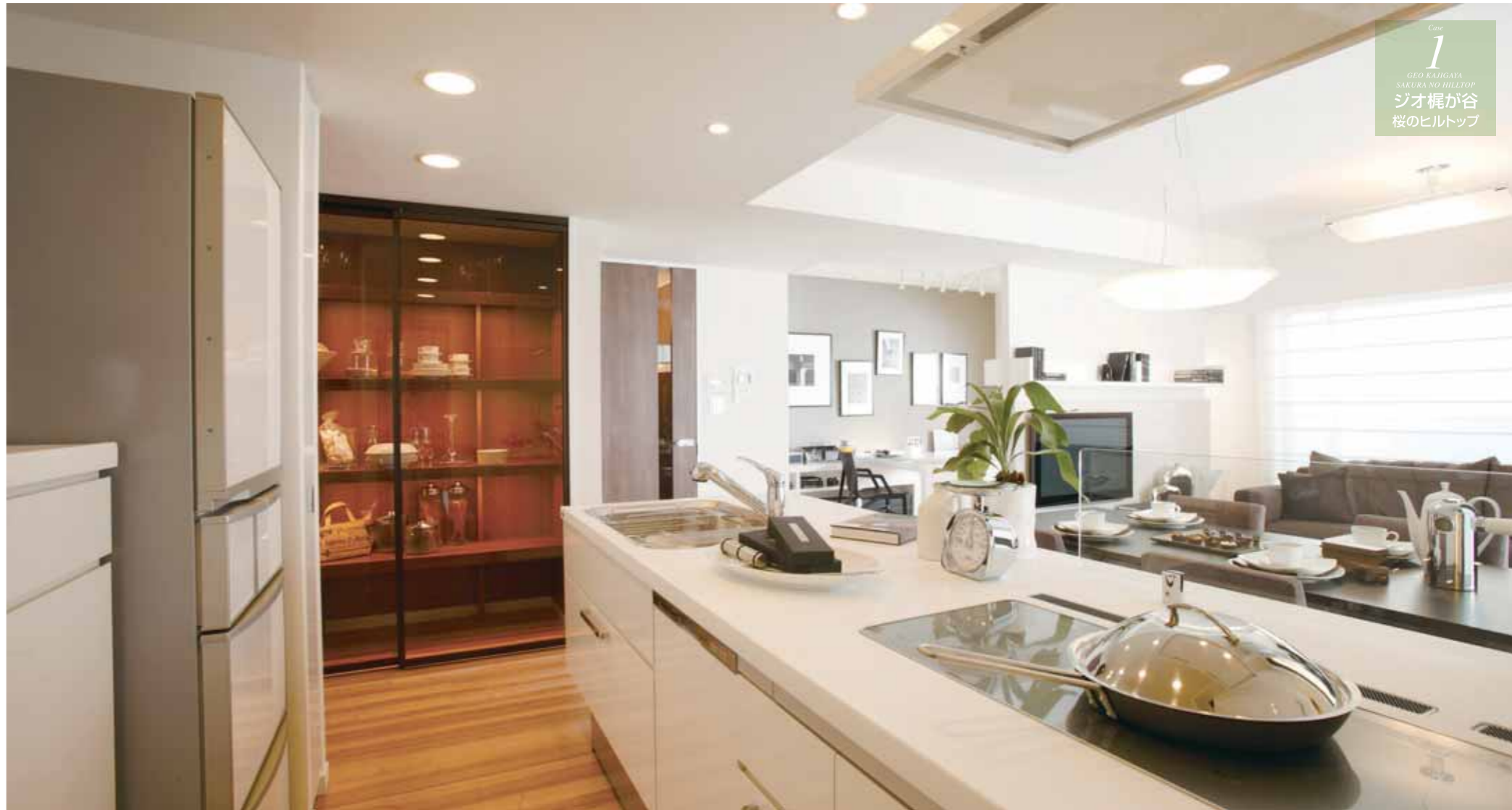
LDK一体空間で家族との楽しいコミュニケーションを