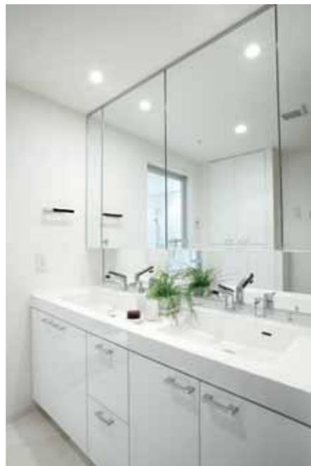
2ポールが便利な洗面化粧台i-X