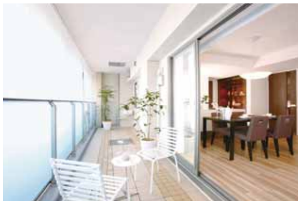
ゆとりの広さがあるバルコニー