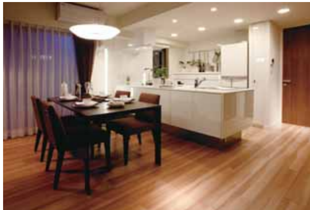
主婦の視界が明るい開放的なダイニング・キッチン