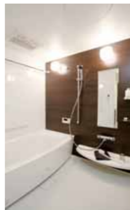
ワンランク上のくつろぎをめざしたバスルーム i-X