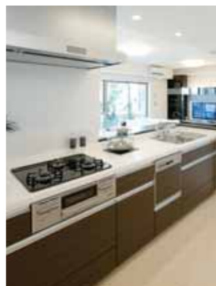
上質感と機能性を兼ね備えたキッチン LS-i