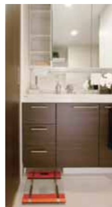
使いやすさを追求した洗面化粧台 i-X