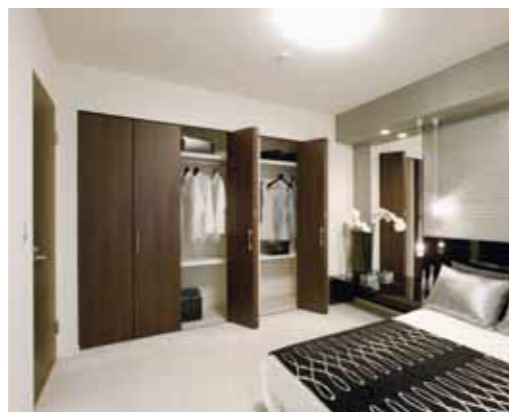
ワイド設計による収納力の高さに加え、内装ドアと同僚匠のデザイン性も魅力的なクローゼット