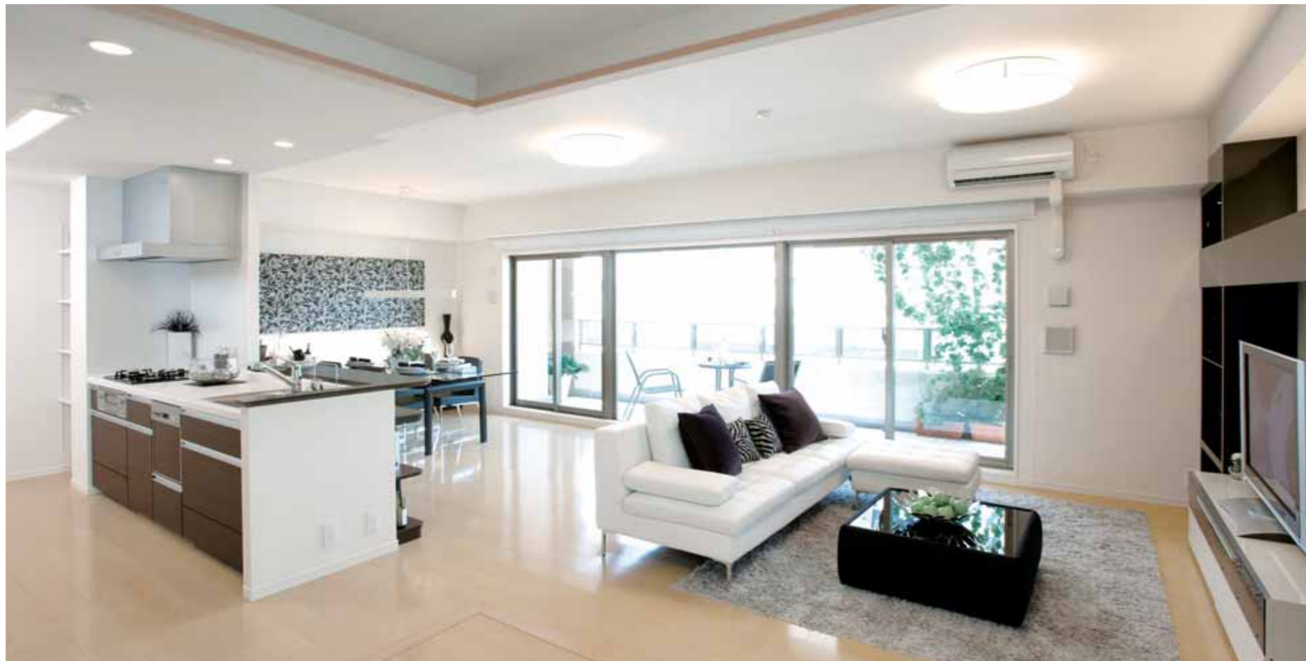
フルオープンアイランドキッチンLS-iが映える、開放感とクオリティ感あふれるLDK