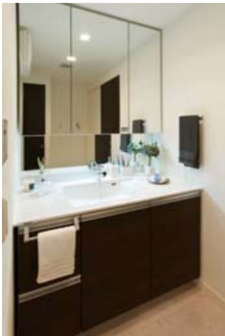
スキマレス排水口、有機ガラス系新素材洗面カウンターを 装備した洗面室

■DATA 物件名: モントレー新宮セントラルステーション 所在地: 福岡県糟屋郡新宮町緑ヶ浜4丁目1316番1 事業主: 西武ハウス株式会社 設計・監理: 株式会社 マサキ設計事務所 施工: 株式会社 旭工務店 敷地面積: 3,307.00m 2 建築面積: 2,394.15m 2 延床面積: 12,518.73m 2 構造・階数: 鉄筋コンクリート造 地上14階建 総戸数: 121戸(専用住宅・118戸/店舗・3戸) 竣工予定: 2012年9月下旬