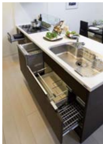
食器洗い乾燥機やワイドなシンク、 ふきん・まな板乾燥機を標準装備