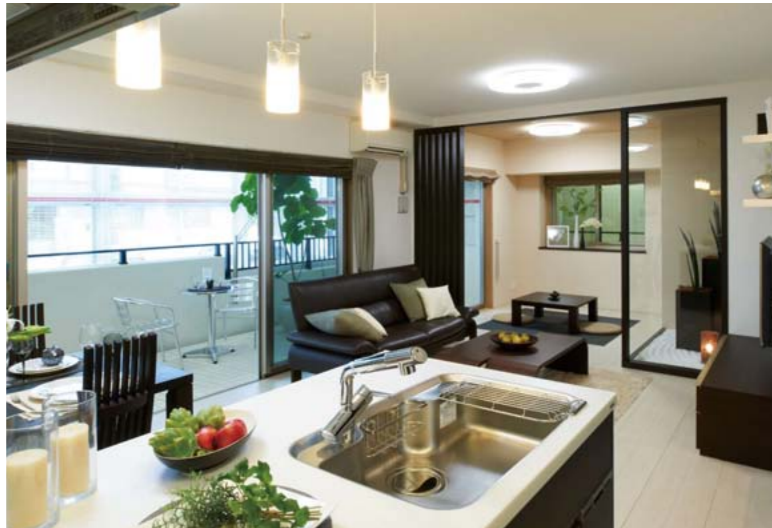
オープンキッチンの開放的で明るいリビング・ダイニング