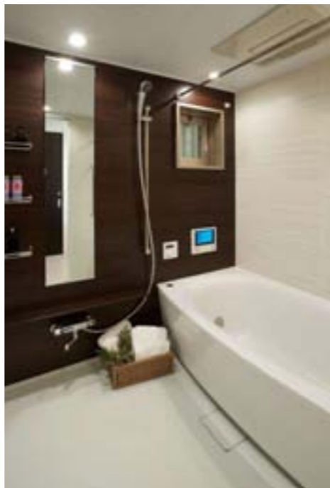
有機ガラス系新素材の浴槽、浴室暖房乾燥機、 さざっとキレイ排水口などを採用したバスルーム