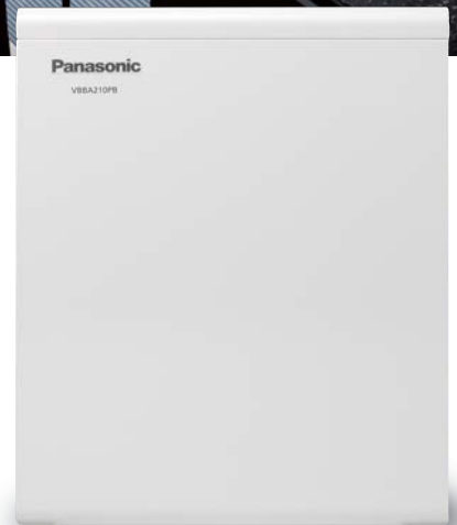
蓄電システム本体