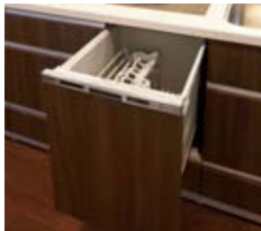
6人分が洗える大容量で、少ないときは自動的に節水する、エコナビ搭載の食器洗い乾燥機