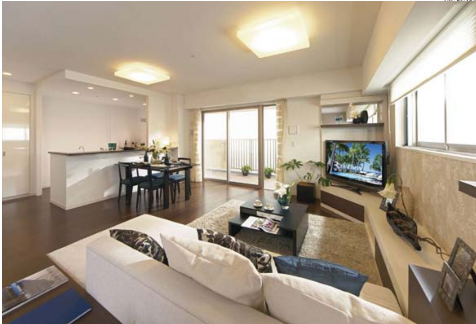
明るく上質な内装でまとめられたリビング・ダイニング。全室バリアフリーの開放感あふれる空間がゆとりをかもします