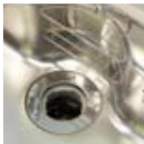
素早く生ゴミを処理する安全・節電・節水設計のディスポーザー