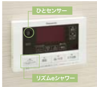
エコナビ搭載エコキュートの浴室リモコン。リズムeシャワー機能も装備