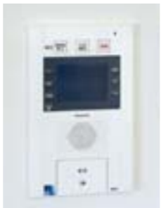
エントランスおよび各戸の玄関に、Smart MONION 埋込型を設置