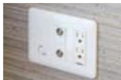
シャッター付きで安心なマルチメディアコンセント