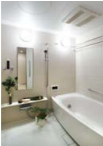
1620mmのゆったりしたバスルームi-X。浴室暖房換気乾燥機付き