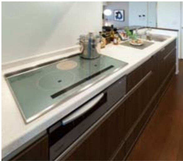
シンプルで使い勝手の良いキッチンLS-iは、ワイドな2700mmを採用