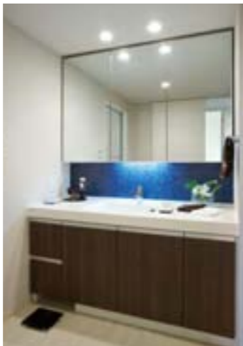
洗面化粧台 i-Xは、ポウルー一体型カウンターと鏡裏収納付き三面鏡ですっきり