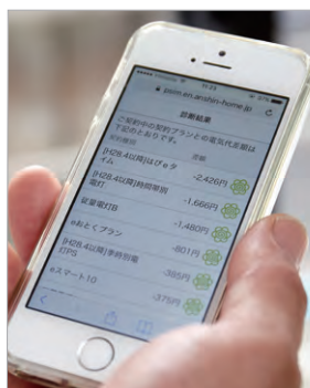
電力料金プラン診断画面。