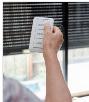
ご高齢のお母様でも操作しやすい専用リモコン。