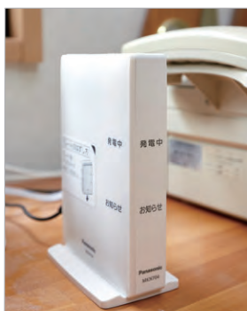
Mさま邸に設置されたAiSEG2。

HEMSサービス」アプリで電力料金のプラン診断ができました。今契約しているプランと他のプランを比べて、電気代がどのくらい変化するかひと目で確認できるのいいですね。電力自由化になって1年経ちますが、近所で電力会社を変更してる人の話を聞くと、電気代が安くなったり、あまり変わらなかったりいろいろあるようです。その点、「スマートHEMS」では、家の電気の使用方を実際に見て料金プランが検討できるので、信頼性が高いなと思います。