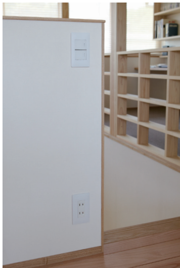
家族のスタディースペースにも アドバンスシリーズ

操作性も進化していますよね。指先で軽く触るだけのタッチ操作や、スイッチのON/OFFを音で知らせてくれる機能などには、お年寄りや子どもたちへのやさしさを感じます。