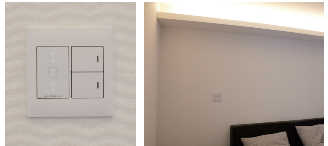
落ち着いた雰囲気を醸し出す建築化照明の寝室とタッチ調光スイッチ

建築化照明で、30～100%の間で明るさの調節ができる調光機能はとっても便利です。