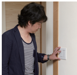
間接照明をタッチ調光スイッチ で操作