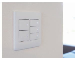
白い塗り壁と調和するスイッチ

塗り壁に調和するマット仕上げも、日本人の美意識に応える質感なので気に入っていますが、壁の色とのマッチングには神経を使いましたね。完成してみると、スイッチが思っていたより若干白かったので、壁の色をもう少し白くしておけばさらに満足度が上がったことでしょう。図面上ではOKで