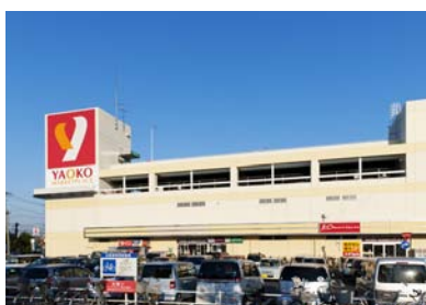
朝の開店前から行列ができる 人気店ヤオコー狭山店

当然、店舗数も多く、改正省エネ法の対応が求められていました。そこで、同社のモデル店になっている狭山店の照明器具を一部改修し、省エネ化を図りました。