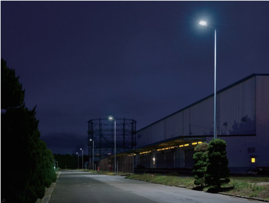
構内道路を明るく照らす「LED道路照明灯」。「明るくなった」と従業員の方からも好評