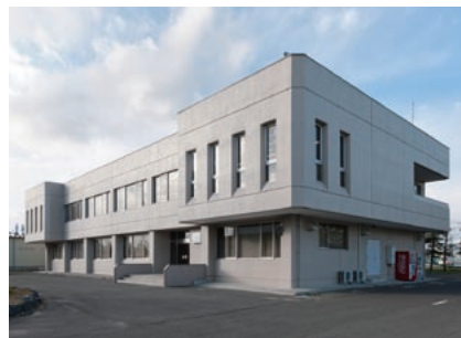
省エネ工場として完全復興へ向かう本社事務所棟