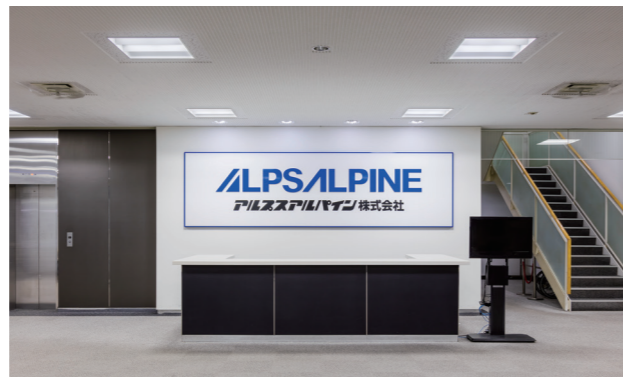
いわき事業所 受付