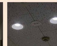
人が通ると100%点灯に。夕方になると自動的に照度を落とすよう設定されています。