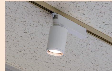
5号棟には同社の商品開発の歴史がわかるミュージアムも併設されています。入口サインを演出するのは、TOLSO BeAm Free スポットライト。配光角を簡単に調整することができます。