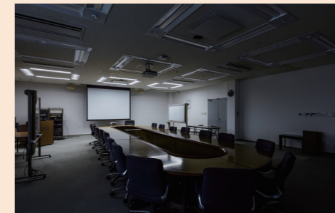
プレゼンテーション時は前面のみ点灯するシーンに設定。ボタンひとつで切り替わるので便利と好評です。