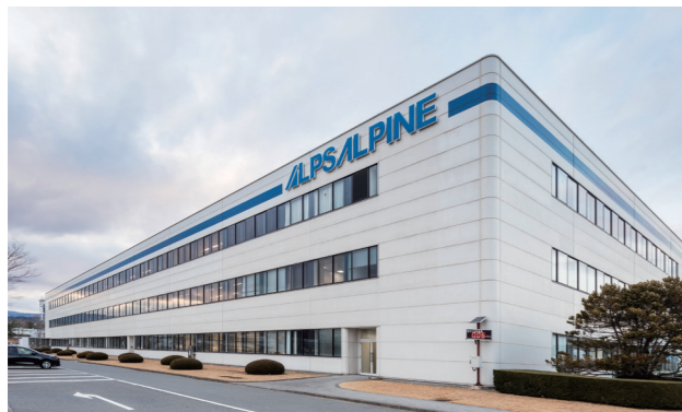
いわき事業所 外観