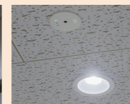
PiPit調光シリーズのダウンライトと受信機。PiPit調光は信号線工事が不要の省施工。受信機が人を検知します。