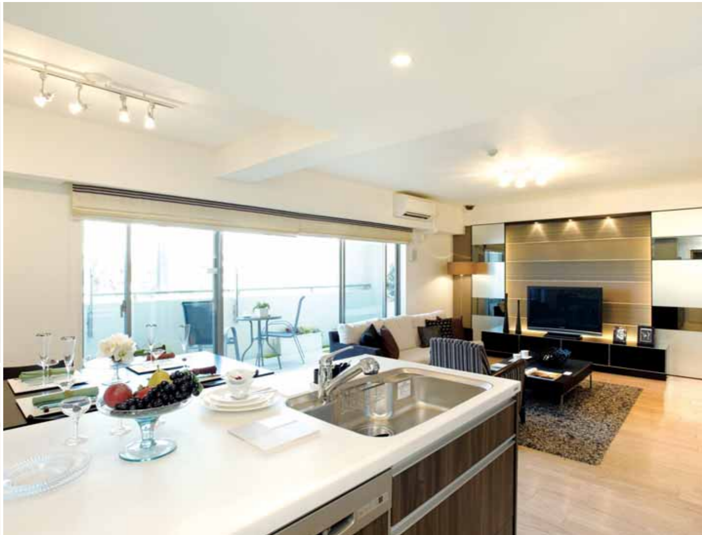
フルオープン開放感と機能美が際立つ、スタイリッシュなアイランドキッチンLS-i