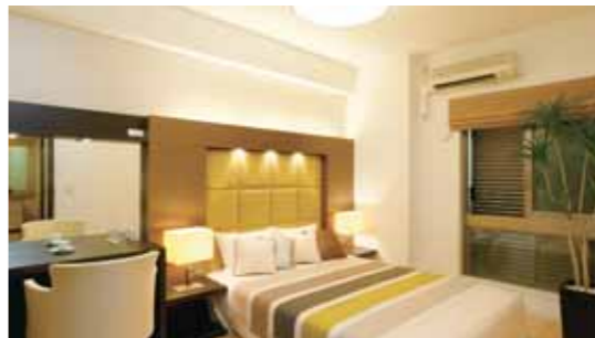
落ち着いた雰囲気の主寝室