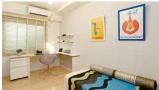
明るく使いやすい子供部屋