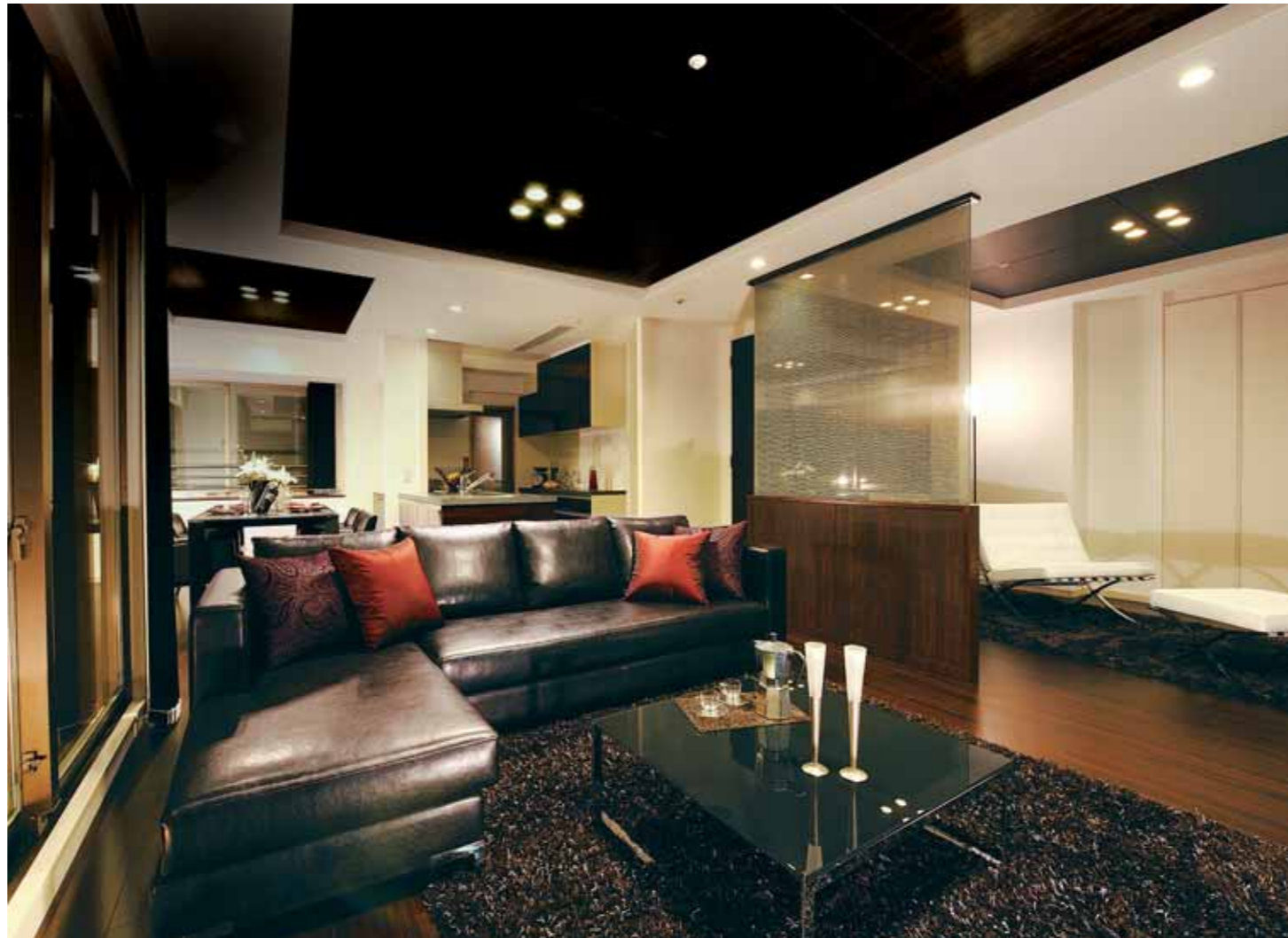
LED照明が、ワンランク上のクオリティを感じさせる空間を演出