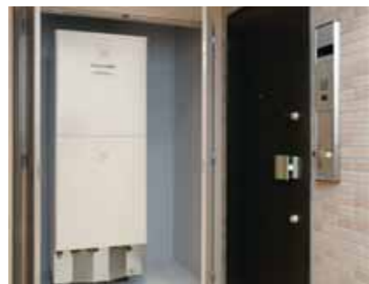
エコナビ搭載エコキュートのタンクはメーターボックスにすっきり配置