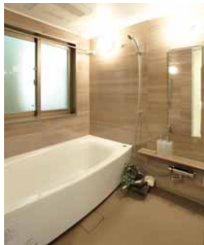
ゆとりある浴槽のバスルーム i-X