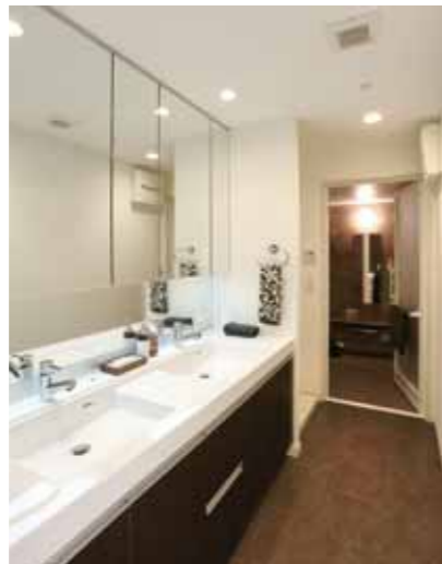
家族が揃って使える2ボールの洗面化粧台i-X