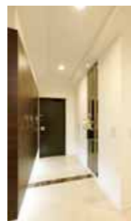
玄関収納コンポリアで広々玄関に