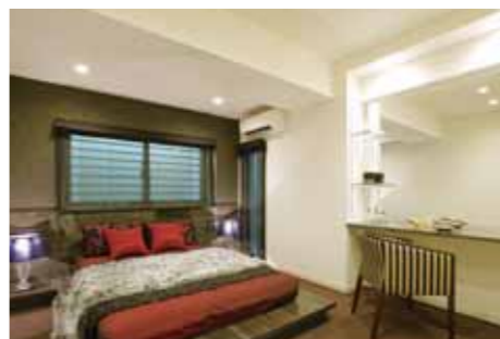
上質感のある主寝室