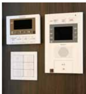
エコキュート台所リモコン(左)と住宅情報盤(右)