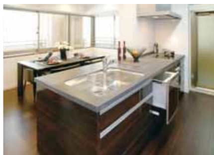
IHクッキングヒーターが装備された機能的なキッチンLS-i