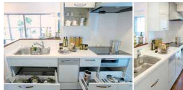
IHクッキングヒーター、食器洗い乾燥機に加え、フラップアップ扉の吊り戸棚やソフトクローズ機構の引き出し収納を装備したLS-i