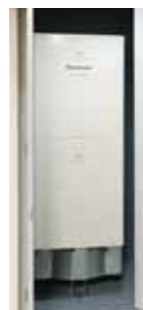
エコナビ搭載エコキュート