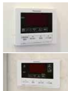
エコキュート台所リモコン(上)と浴室リモコン(下)