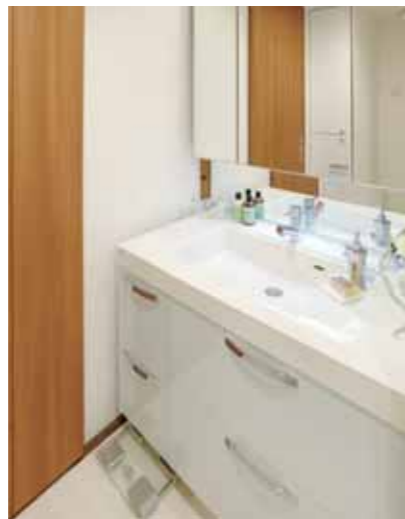
大容量の収納も喜ばれる洗面化粧台i-X

※フルオート、当社試験設備にて、高断熱浴槽使用 浴槽湯量180L 設定温度42℃ 外気温7℃ 貯湯温度75℃ 接続配管φ13A 架橋ポリエチレン管10m 断熱材あり ふろ沸りは完了後120分保温した場合の比較（湯温学習後）、エコナビON時1380kJ/OFF時2120kJ ただし、酸素濃度を下げている場合は除きます。