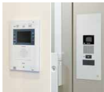
住宅情報盤(左)と住居前の訪問者を画像で確認できるカメラ付きドアホン(右)