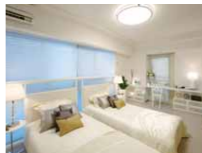
ゆとりある広さの主寝室