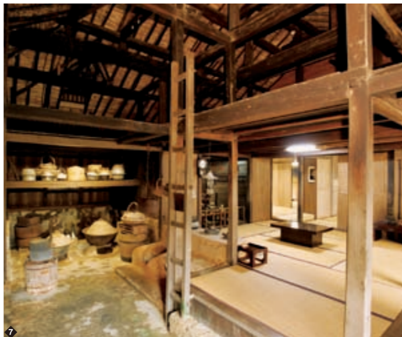
7 かまどの奥に家を守る神、火の神(ヒヌカン)が祭られている。もとは極楽浄土(ニライカナイ)を遥拝していたが、中国の道教のかまど神と融合し固有の信仰となった。竹が葺かれた屋根に、息道(イーチミー)と呼ばれる通気孔が見える。屋根裏は薪や食料の貯蔵場所として利用した