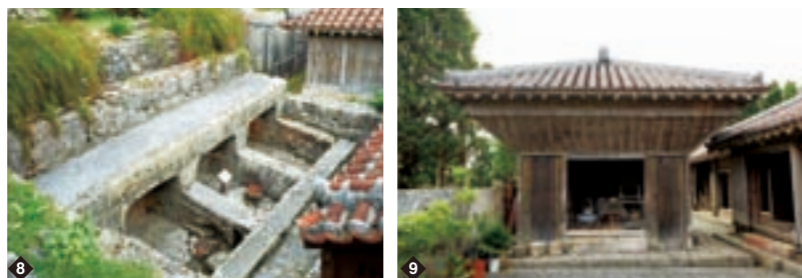
8 敷地の北西に作られた豚の飼育所。石垣いの手前に人間の便所があり、排泄物が豚の飼料になる仕組みだった 9 ネズミ返しの傾斜が目を引く高倉。中村家住宅は士族の屋敷に、農家の建物が付随しているのも特色