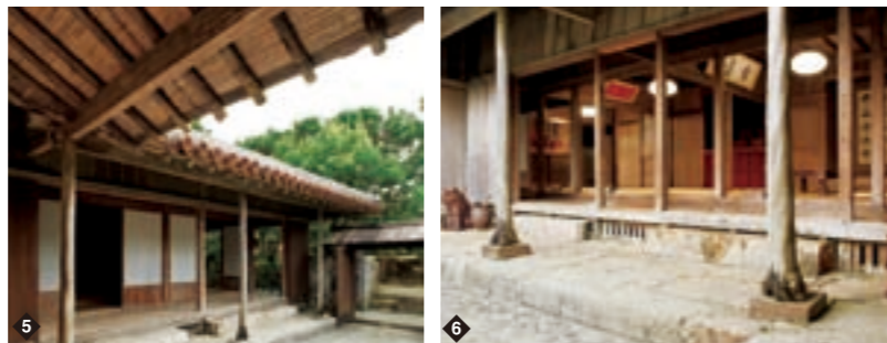
5 一般的には建物の南と東に庇のような雨端(アマハジ)を設け、雨と日差しを遮る。建物外周の腰下部材の腐食を抑える効果もある 6 柱材は、当時の農民には使用が禁止されていたイヌマキとモッコク。防虫効果があるイヌマキを、水に強い根元の部分から雨端柱に利用している