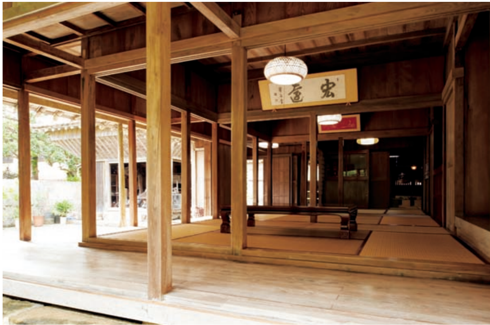
◆南と東の開口部は広く、風が家を通り抜ける。手前が一番座。続く二番座は先祖の位牌をまつる、いわば仏間。先祖崇拝を重んじる沖縄では仏間を家の中心に置く

日本本土のはるか南西、東シナ海に位置する沖縄は、古くから日本だけでなく中国とも深い関わりがありました。このため、伝統的な住まいには両国の影響が見られます。また、厳しい暑さや台風といった亜熱帯気候に耐える工夫にも特徴があり、沖縄ならではの建築様式が育まれました。中村家住宅は18世紀中頃に建てられた豪農の屋敷で、1972（昭和47）年の沖縄本土復帰と同時に国の重要文化財に指定されています。