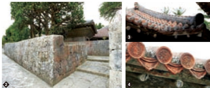
2 高さ2mを超える石垣。門扉はなく、奥に顔隠し塀(ヒンプン)を設けて母屋を見通せないようにしている。顔隠し塀は中国の屏風門にならったもので、真っ直ぐにしか進めない邪気の侵入を防いだともいわれる 3 1889(明治22)年以降、琉球王国時代の制限令が解かれ、赤瓦の利用が農民に許された。赤瓦に含まれた雨水は、屋根の温度を下げながら気化する 4