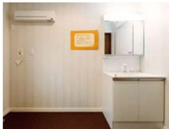
部屋干しファン™ せんたく日和®があれば、天気は左右されずに洗濯ができ、家事の効率もアップ