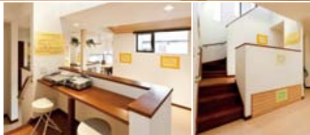
スキップフロアからリビングを見渡せるので、小さいお子様の動きが見守れます