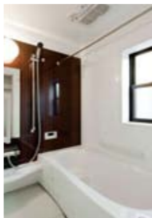
有機ガラス系人造大理石の浴槽はエスラインをご採用