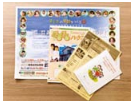
家づくりに役立つ情報誌なども発行。地域の問題も掲載して親しみが持てます