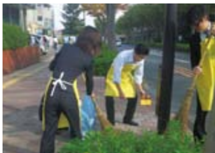
毎週月曜日に実施されている地域の美化活動。きれいなまちづくりをみんなでお手伝い