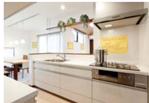
リビングステーション Sクラスをご採用。収納量が豊富で、使い勝手のよいスライドタイプのフロアユニット