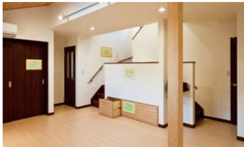
スキップフロアをワークスペースにすることでリビングが広々。段差を利用した収納も魅力