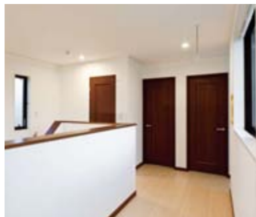
部屋干し用としてはもちろん、暮らしの工夫が生かせるフリースペース