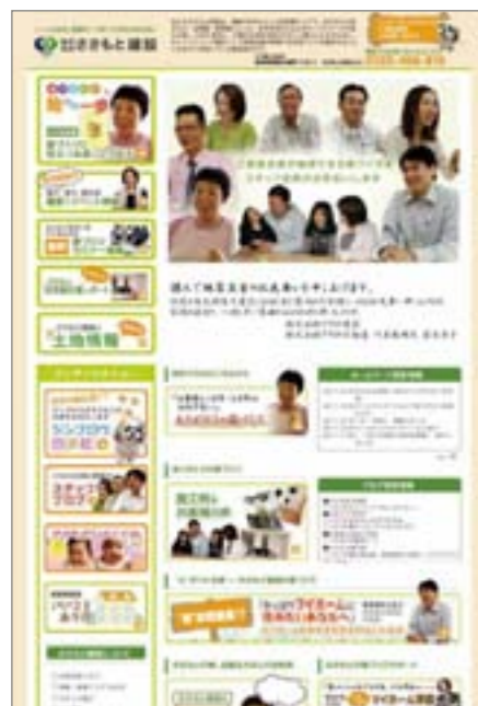
ホームページはこまめに更新し、新鮮な情報を発信。お客様からのご期待に応えておられます