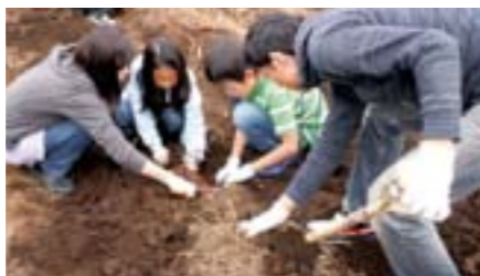
農園委員会のメンバーが無農薬野菜を育てておられ、秋の芋掘り大会にはお客様をご招待されます