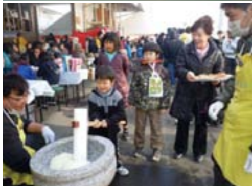
交流、情報交換の場になっているもちつき大会。614名が参加され、東北の物産販売など、被災地域支援の試みもありました