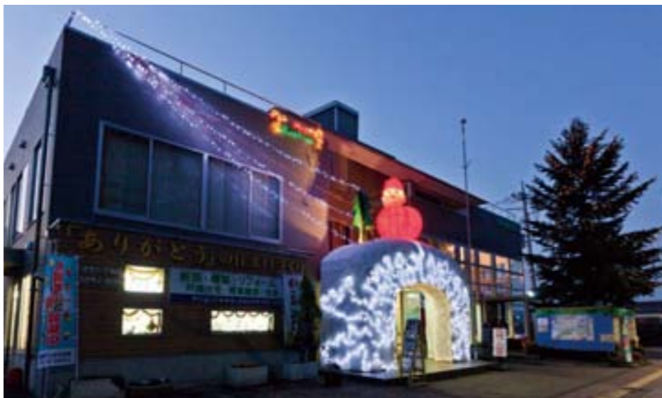
社屋前を通るかたに楽しんでいただこうと、季節ごとに工夫を凝らした飾り付けをされています。12月にはイルミネーションも点灯。12回目になりました