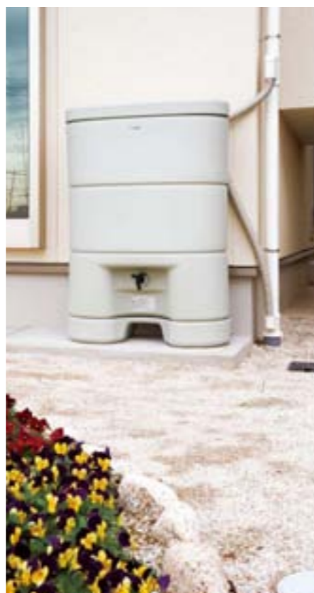
150Lの雨水を溜める「レインセラー」

ブラザー不動産株式会社 http://www.brother-bre.co.jp/