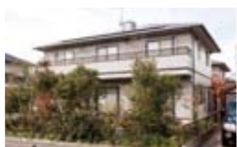
太陽光発電システムを設置された目黒邸

平成8年、この地に新居を建てました。そして昨年の10月、太陽光パネルを設置しようと考えていたところ、レインセラーのパンプレットを入手し、採用を決めました。庭にレインセラーを設置すればガーデニングに便利で、水まきに飲料水を使うこともなく、水道代も削減できることが魅力でした。