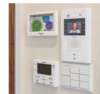
太陽光発電システムの発電量や売電量が「見える化」できるエネルギーモニター(左上)