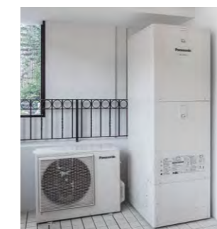
ベランダに設置されたエコキュート (370L)