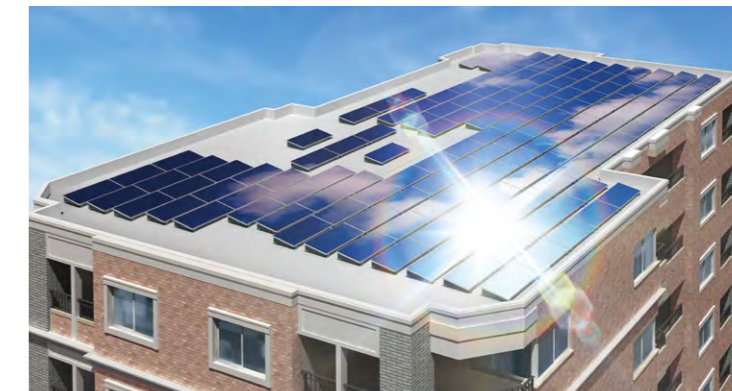
屋上に設置された太陽電池モジュール HIT233 (140枚)