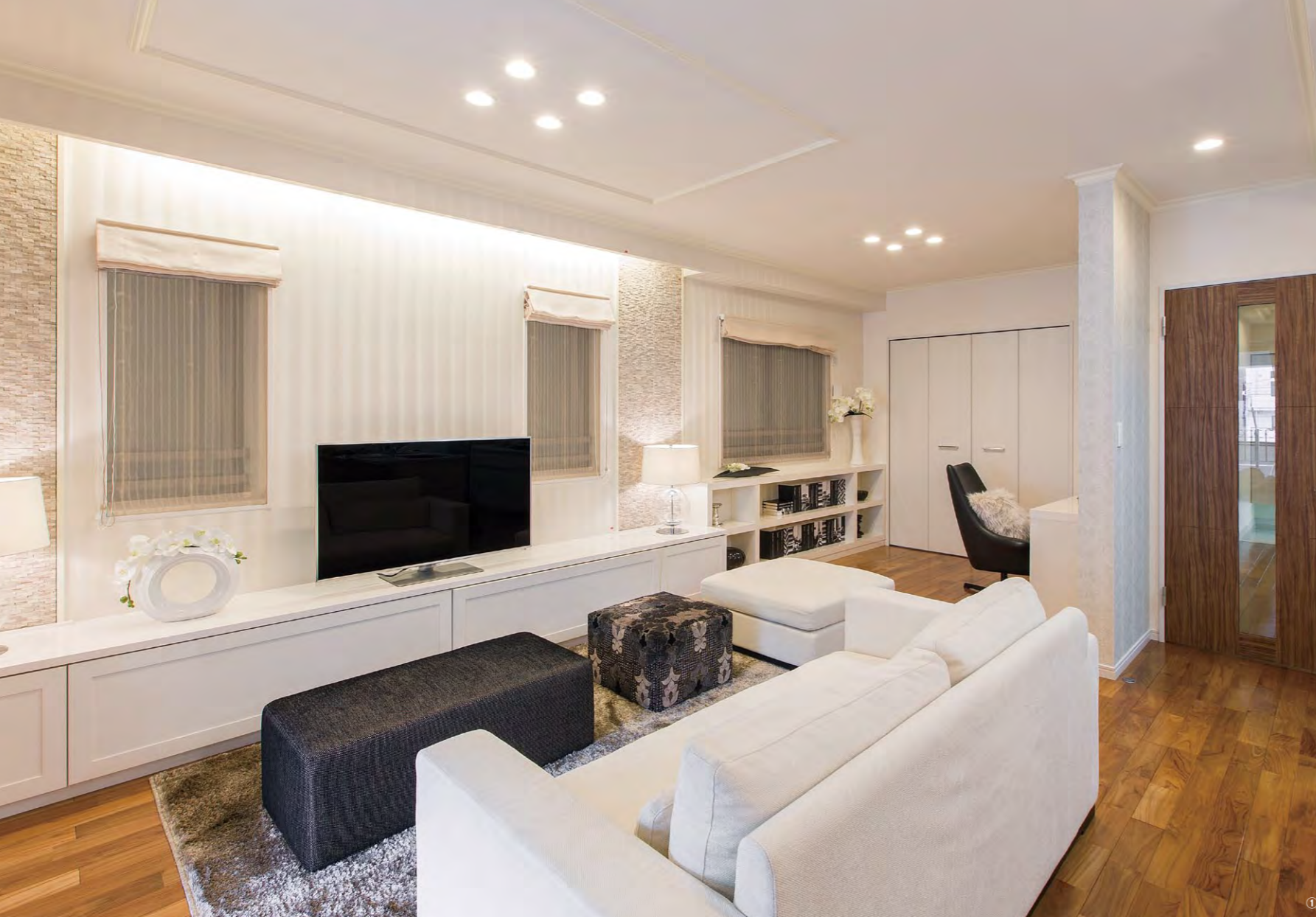
①屋上に設置された太陽電池モジュールによる電力が、照明や各種電化機器に供給される