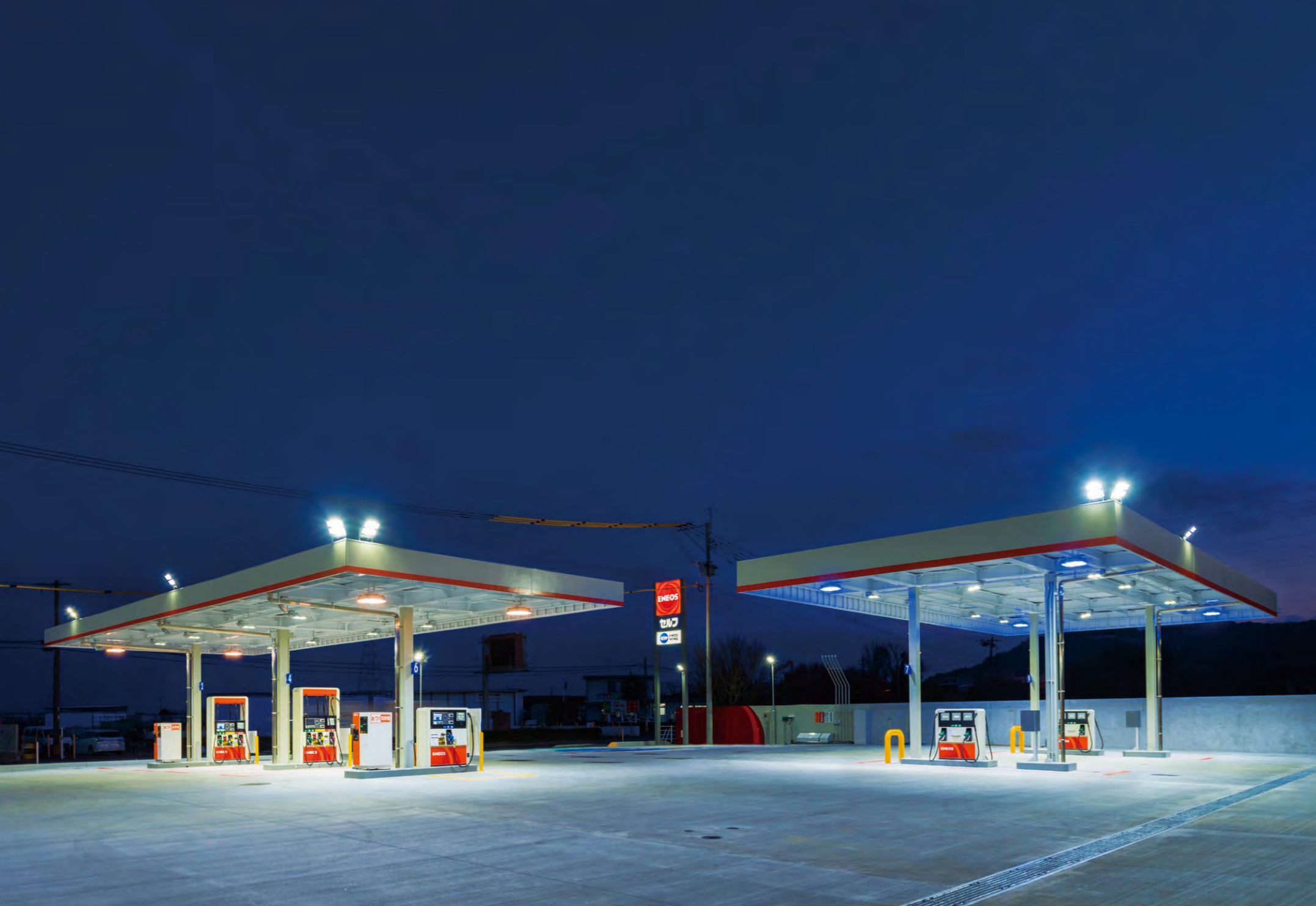
水銀灯と同等の照度を確保するLED投光器に全面リニューアルした植木インターTS