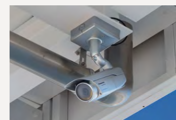
給油セルフサービスをサポートするネットワークカメラ