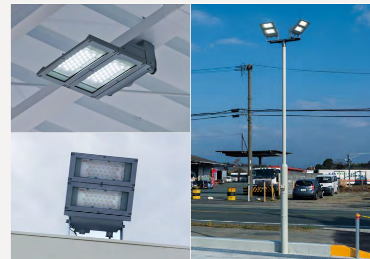
標準品のLED投光器を用いたキャノピー照明(左)、ヤード照明(右)

所在地 / 熊本県熊本市北区植木町亀甲 施主 / 株式会社ENEOSウイング 電気工事 / 真栄電設株式会社 リニューアル竣工 / 2016年2月