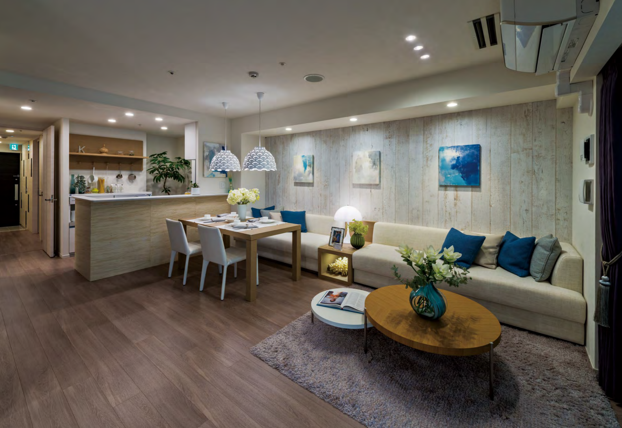
上質な白を基調とした空間で湘南のリゾート感を演出