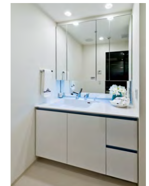
化粧台の高さを上げて 収納スペースを拡大