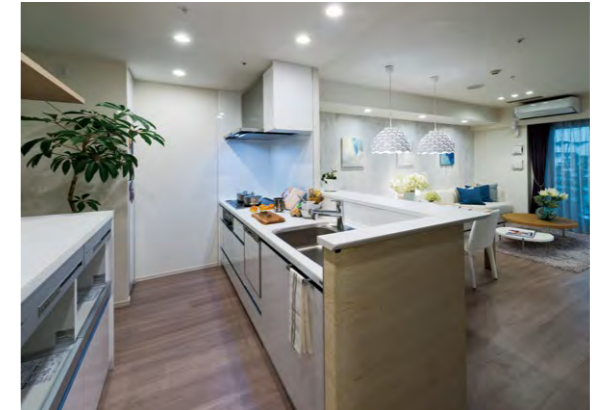
作業スペースを広くとったシステムキッチン

所在地／神奈川県茅ヶ崎市赤松町 事業主／関電不動産開発株式会社、野村不動産株式会社、パナホーム株式会社 設計／株式会社IAO竹田設計 施工／三井住友建設株式会社 横浜支店 内装工事／パナソニックES建設エンジニアリング株式会社 構造／鉄筋コンクリート造一部鉄骨造 地上10階 総戸数／352戸 竣工／2018年1月末(予定)