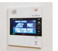
Windeaに 電気使用量を表示