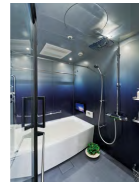
濃紺色のグラデーションを用いて バスルームをコーディネート (i-X INTEGRAL) ※オプション