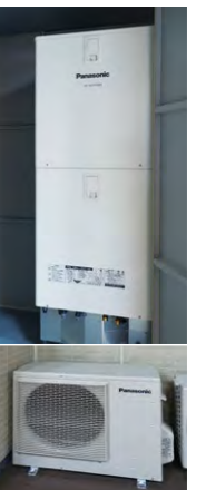
高圧一括受電対応 エコキュート