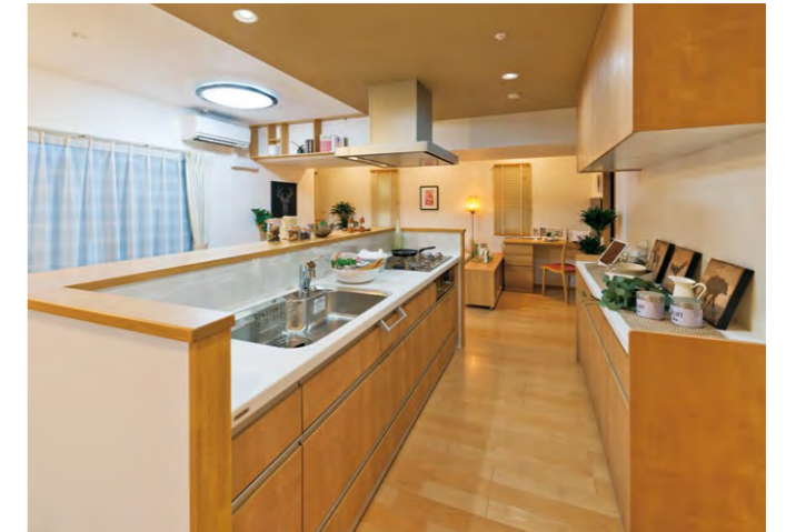
家事動線に配慮された、明るいキッチンスペース

アーデントクレイル山の田本町 所在地 / 山口県下関市山の田本町 事業主 / 株式会社コムズコーポレーション 設計 / 株式会社ワイエム・クリエイティブ 一級建築士事務所 施工 / 株式会社野口工務店 構造 / 鉄筋コンクリート造 地上14階 戸数 / 139戸(販売戸数138戸) 竣工 / 2017年8月(予定)