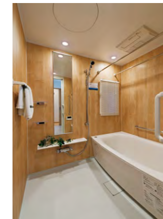
発泡ポリスチレン断熱材で保温特性を大幅向上