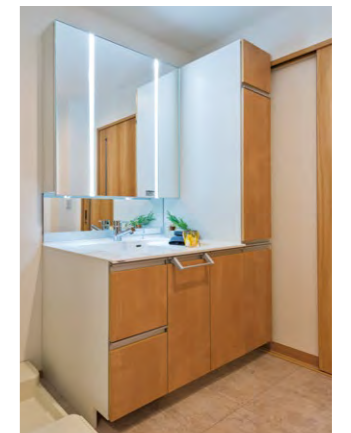
手元と顔を明るく照らすツインラインLED照明