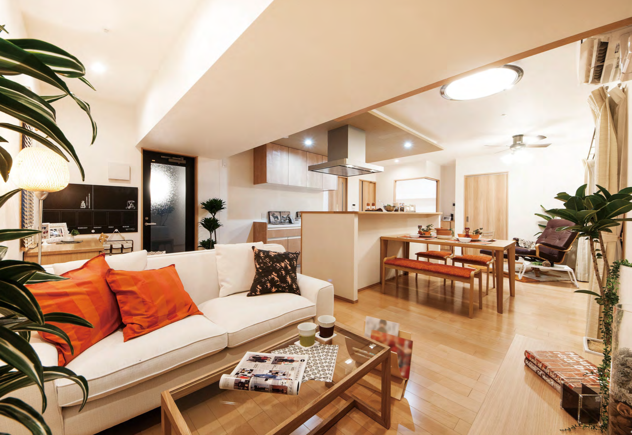
フローリングや建具のカラーがセレクトできる30m 2 基準のリビング・ダイニング

水素社会の到来を見据え 家庭用燃料電池を集合住宅に導入 下関市中心市街地の山の田地区に位置するアーデントクレイル山の田本町。敷地面積約9,590m 2 のショッピングセンター跡地に、南館2棟、東館2棟の4棟138戸の分譲マンションを配置する中、ラウンジスペースや集会室などの共用コミュニティ施設を設け、「永く安心して快適に過ごせる住まい」を追求。太陽光発電や風の取り込み、緑化による遮熱など自然エネルギーを活用。断熱性能を高めつつ、各戸に先進の省エネ設備やECOマネシステムを採用することにより、低炭素住宅の認定を受けている。南館66