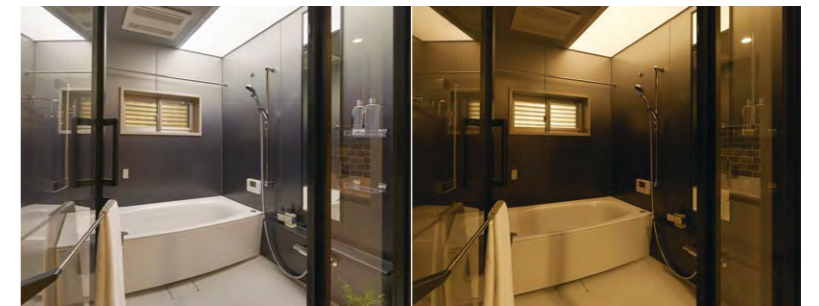
早朝や黄昏の自然光がバスルームに差し込むようなi-X INTEGRALのフラットパネルLED