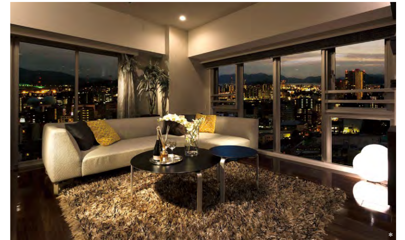
平和大通りに至近の立地に、開放的なリビングスペースを確保

所在地 / 広島県広島市中区小町 事業主 / 東亜地所株式会社 設計・監理 / 株式会社アートライフ 施工 / 三栄建設株式会社 構造 / 鉄筋コンクリート造 地上14階建(39戸) 竣工 / 2017年6月(予定)