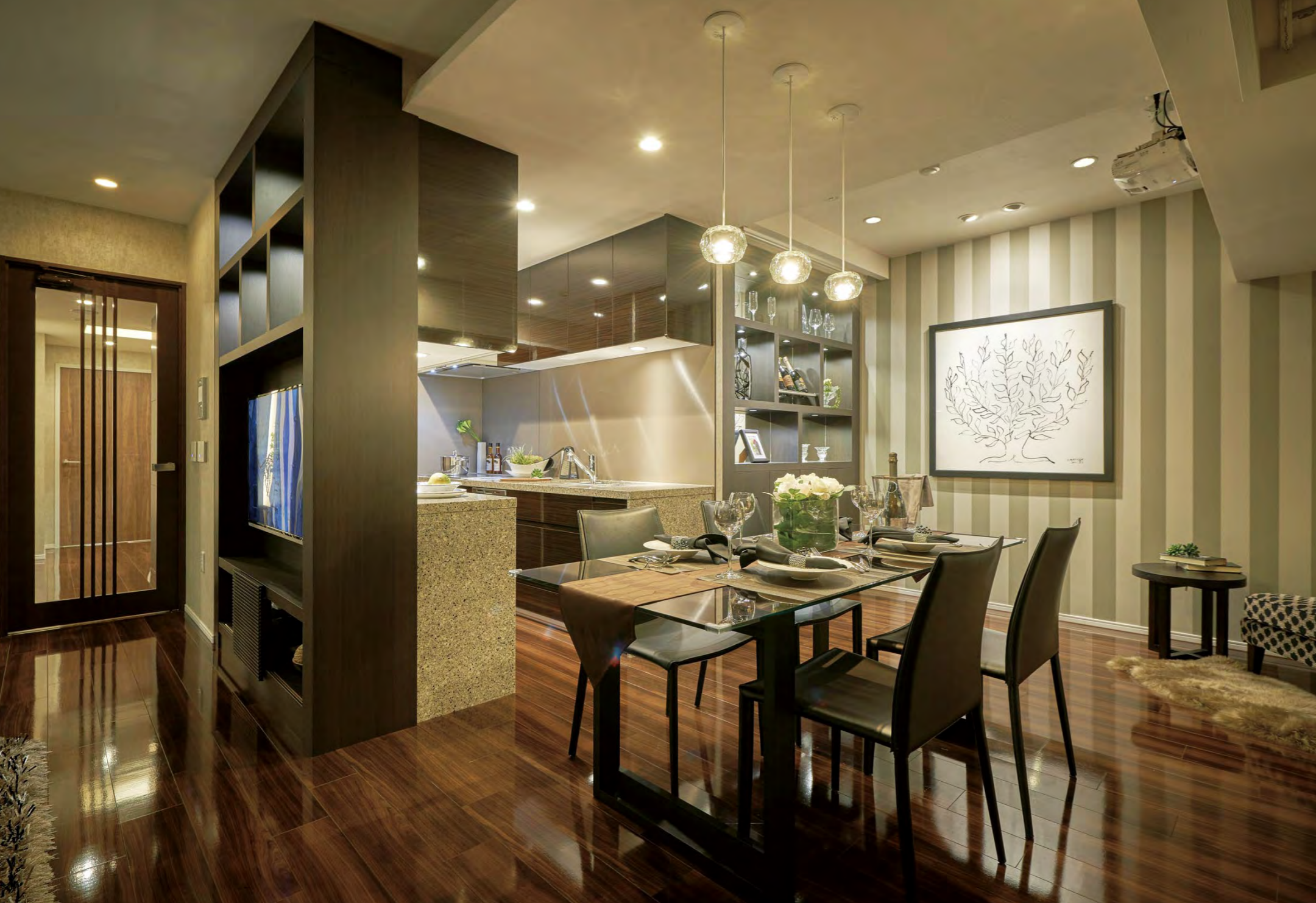
調光・調色が可能なペンダントライトをダイニングに設置し、適所適光の照明計画を提案している。写真はディナーのシーン