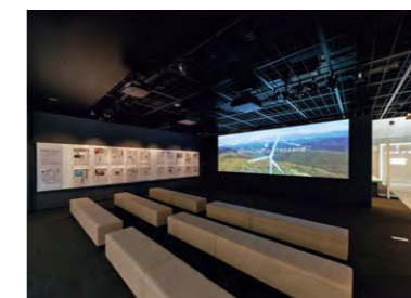
震災から始まる原子力災害との闘いを映す「ふくしまの歩みシアター」