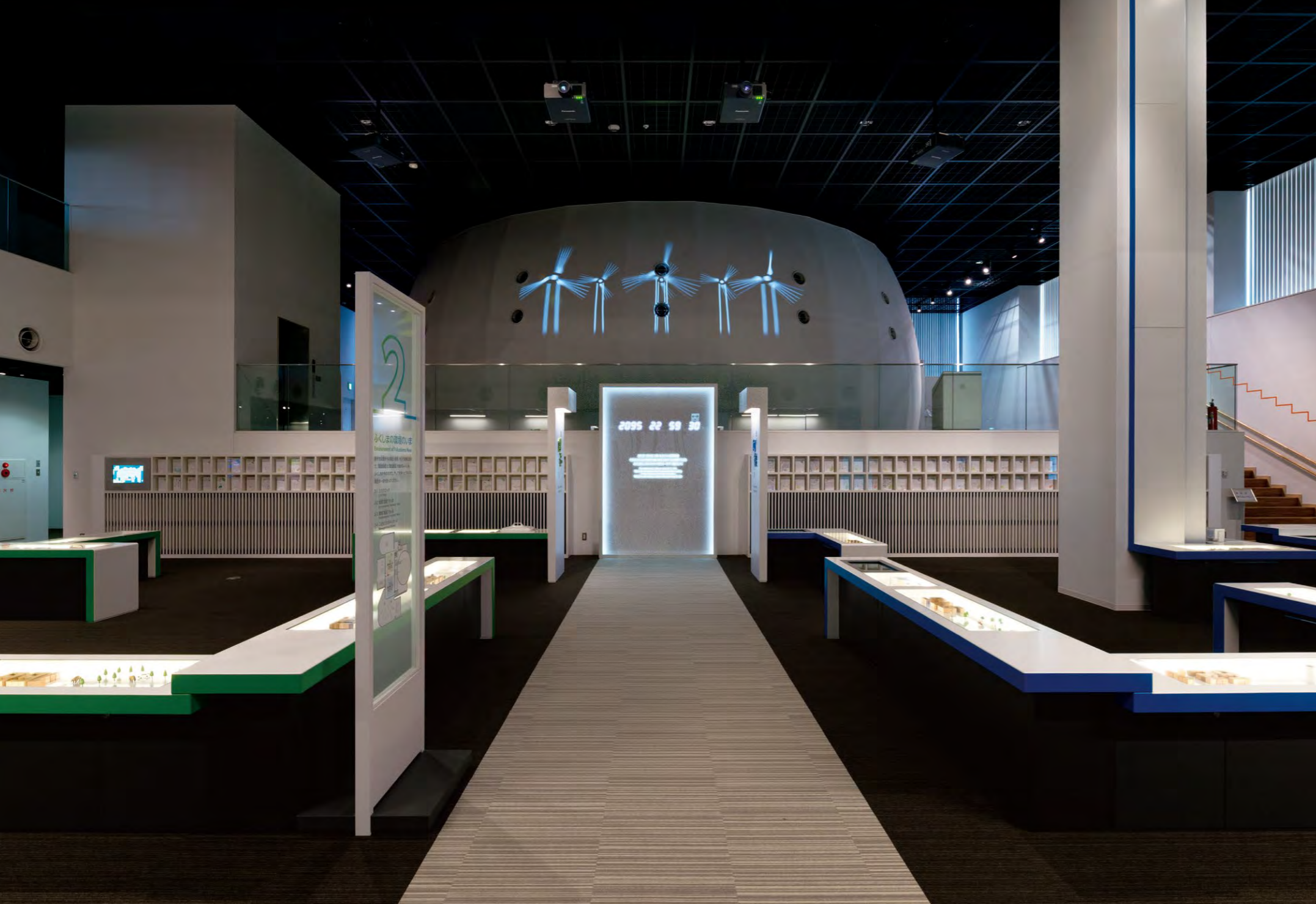
「ふくしまの環境のいま」ゾーンでは、正面に震災から経過した時間を示すクロックが置かれている