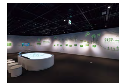
「環境創造ラボ」では8台のスペースプレーヤーが緑のアイコンを投映