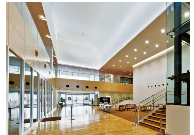
天井に間接照明が設けられた吹き抜けロビー

所在地／福島県田村郡三春町深作 施主／福島県 設計／久米設計・阿部直人設計共同体 建設工事／オオバ・白鳳社・伊藤建設 特定建設工事共同企業体 電気工事／高柳電設工業株式会社 展示設計／株式会社トータルメディア開発研究所 オープン／2016年7月