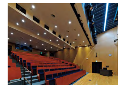
170インチの大型スクリーンを備えたホール