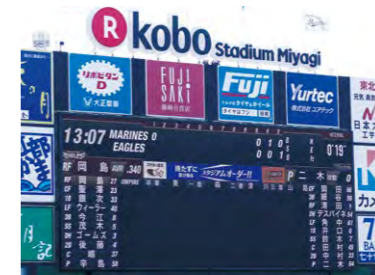
縦10.24m×横28mの大型LEDビジョン

所在地/宮城県仙台市宮城野区宮城野 施主/株式会社楽天野球団 施工/パナソニックシステムソリューションズ ジャパン株式会社 システム導入/2016年5月