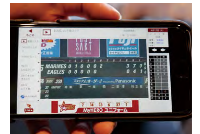
リプレイ動画をSNSに配信