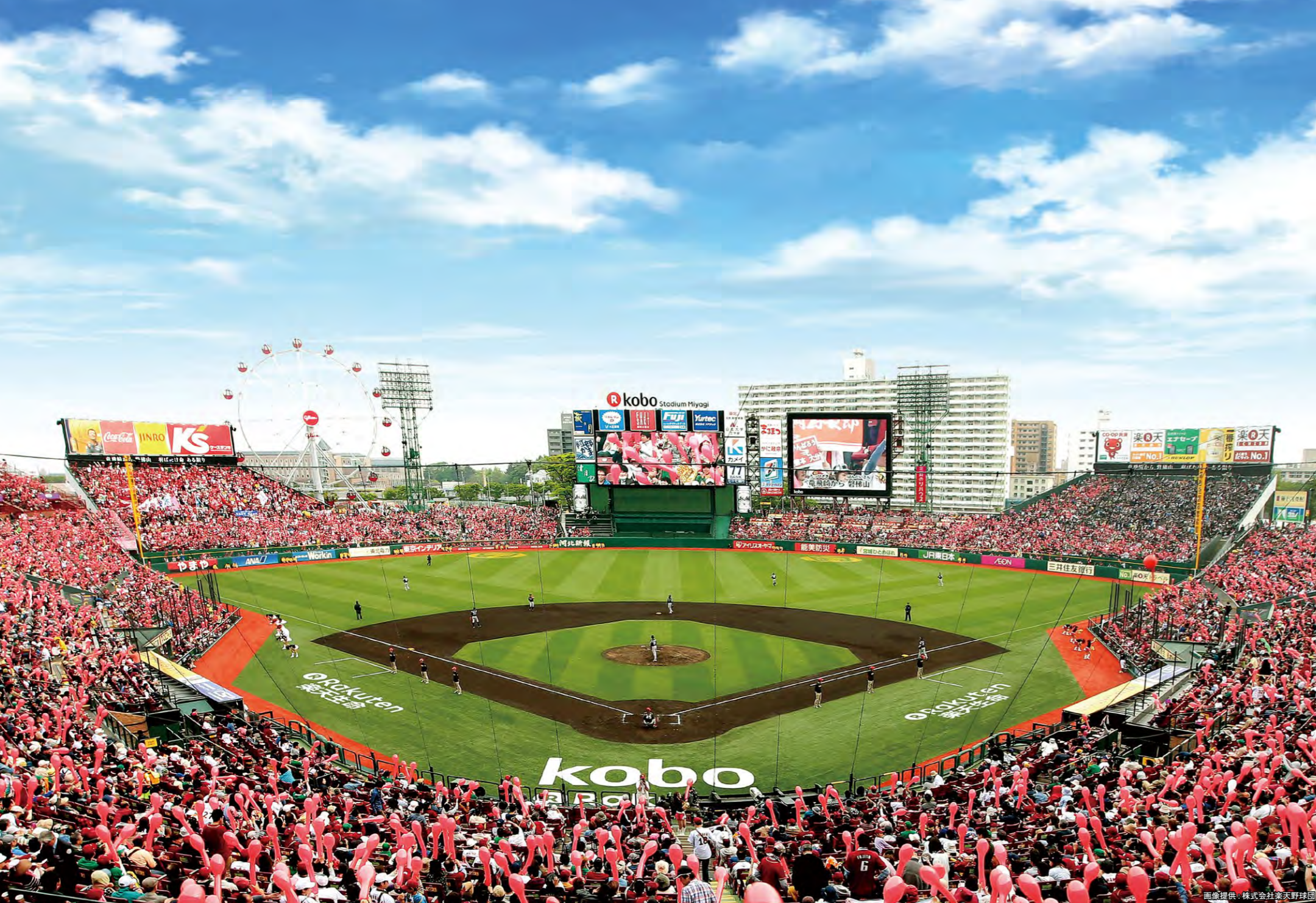
中央の大型LEDビジョン(中央)と他社ビジョン(右)観覧車中央の円形ビジョン(左)やリボンボードなどビジョン11台の映像・音響が連動する