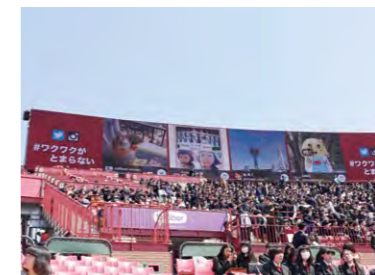
SNSファンメッセージ動画を 大型LEDビジョンにリアルタイムで表示