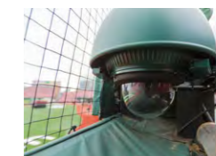
戦略分析システムに用いられる 全天候型4Kドームカメラ