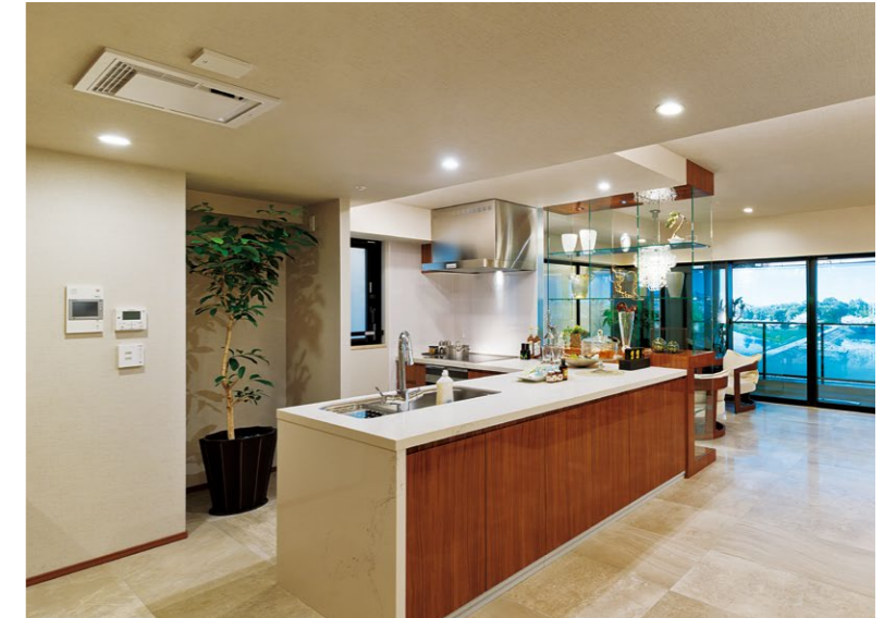
調理のニオイまでも脱臭する天井埋込型空気清浄機「エアシー」(写真左上)

所在地 / 兵庫県西宮市奥畑 地主 / 野村不動産株式会社、関電不動産開発株式会社 設計 / 株式会社IAO竹田設計 施工 / 野村建設工業株式会社 内装工事 / パナソニックES建設エンジニアリング株式会社 構造 / 鉄筋コンクリート造 地下1階 地上3階 総戸数 / 65戸 竣工 / 2018年8月(予定)