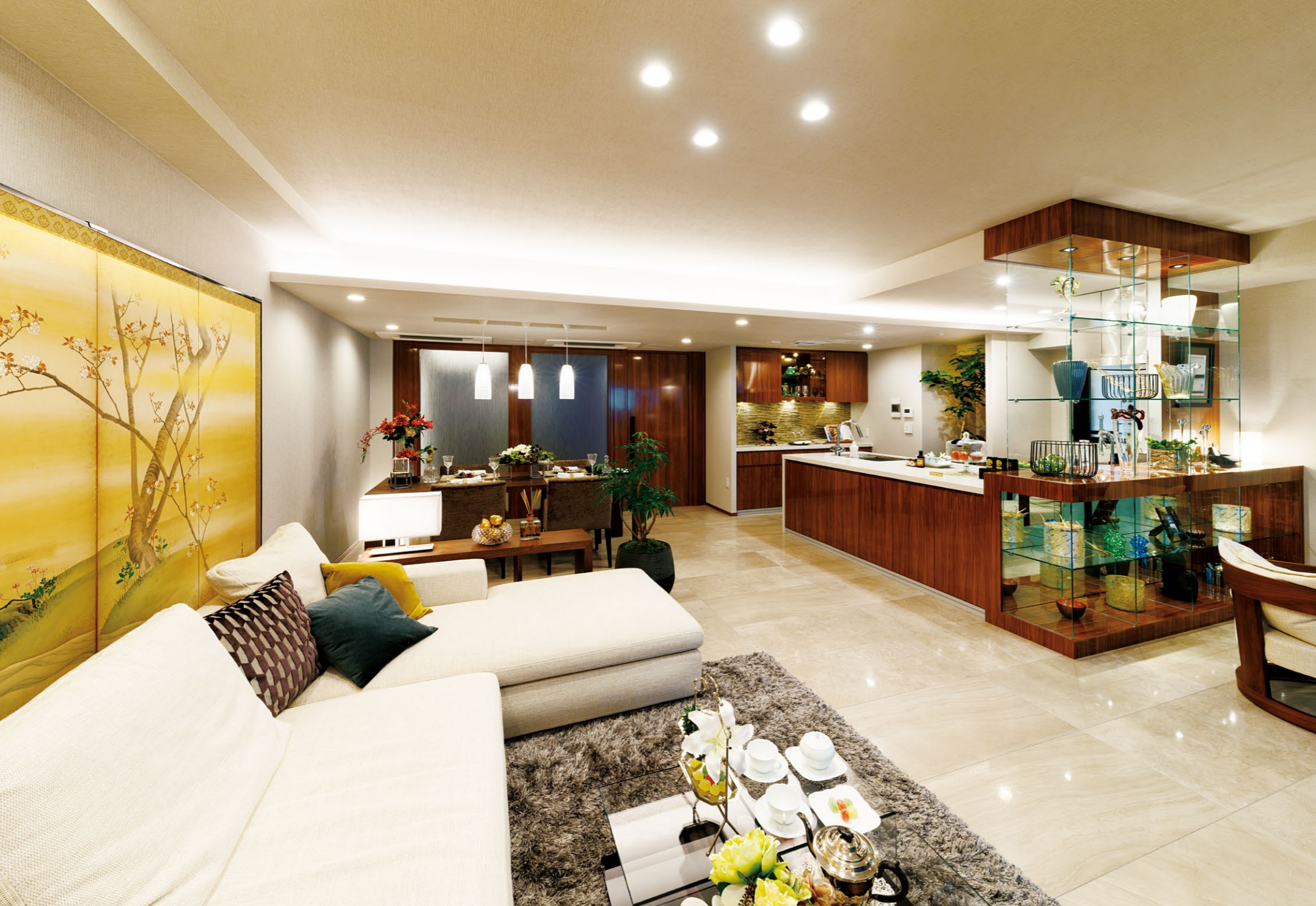
ほぼフリーオーダーに近い内装工事にはパナソニックES建設エンジニアリングのSJP(スマート住空間パッケージ)が採用された