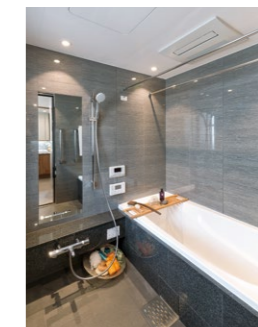
「iミスト」が設置されたバスルーム