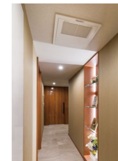
廊下天井の全熱交換器