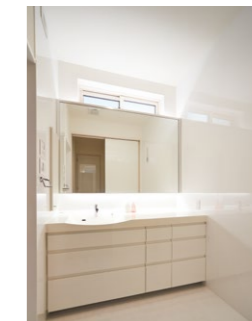
1面鏡の背後に間接照明を設けた洗面ドレッシング Lクラス