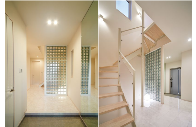
広がり感のある天井高2,700mmの玄関には、ガラスブロック壁の背後にMODIFYを配置

所在地 / 大阪市 設計 / 大和ハウス工業株式会社 施工 / 大和ハウス工業株式会社 竣工 / 2016年11月