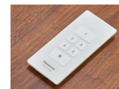
あかりのシーンを切り替える「シーン」リモコン