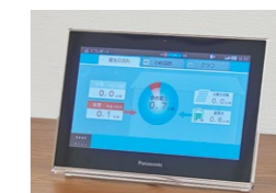
ドアホンとも連動するスマート・ピエラ (住宅機器コントローラーモデル)