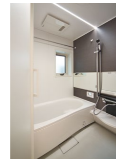
フラットラインLED照明を備えたバスルーム