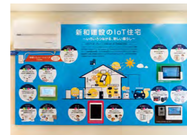
HEMSや設備が稼働する暮らしのIoTコーナー