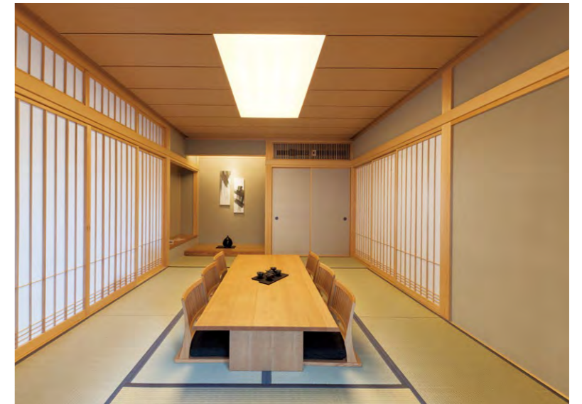
LDKに続く和室は光天井のような照明

所在地／愛知県一宮市丹陽町五日市場 事業主／株式会社新和建設 設計・施工／株式会社新和建設 オープン／2017年8月