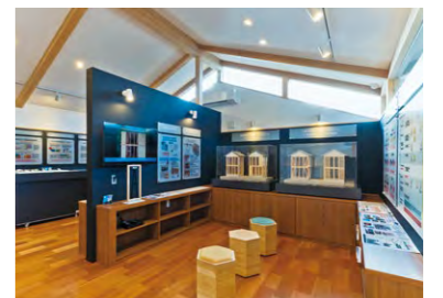
木の良さと耐震が分かる住まいの体感スタジオ