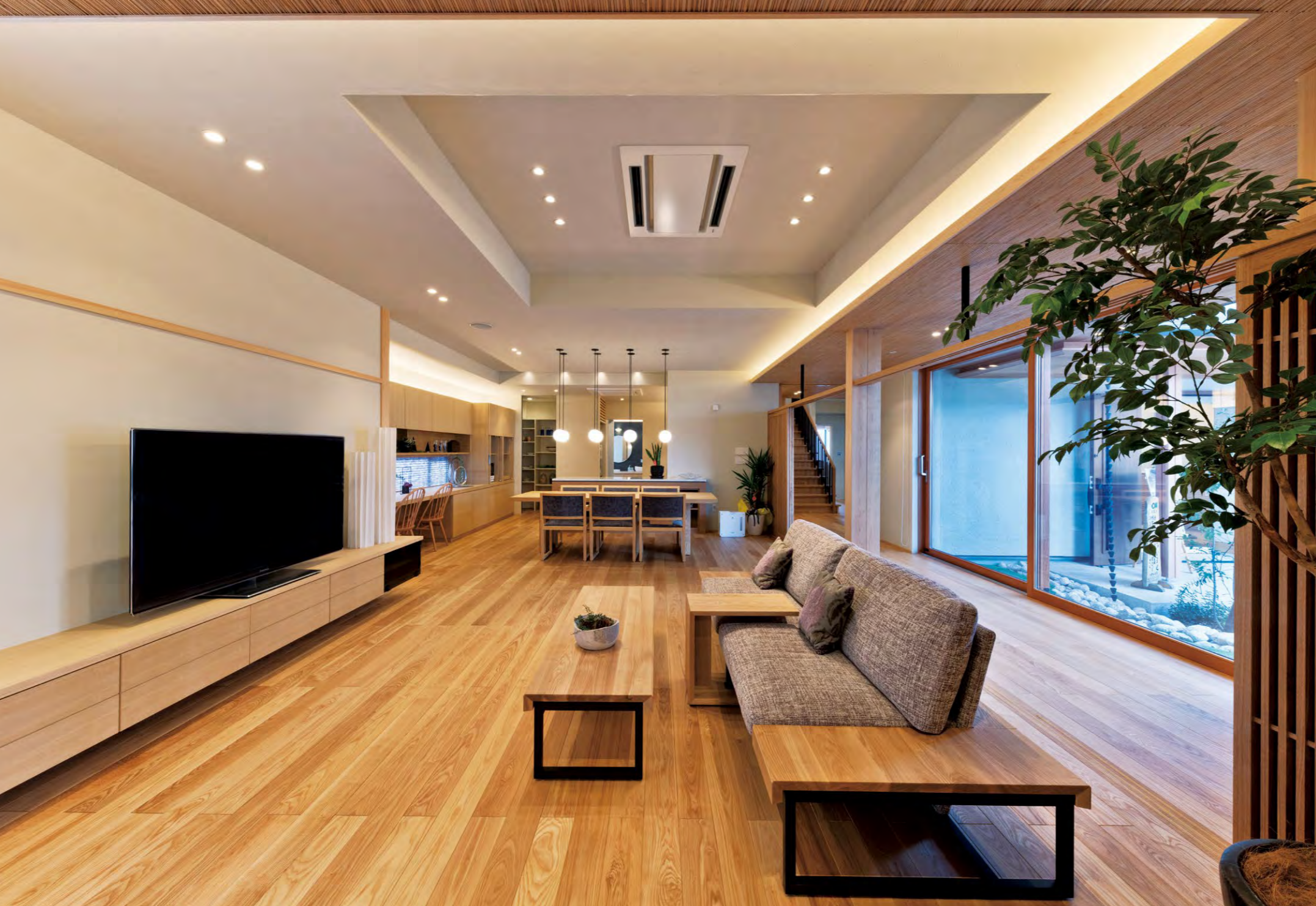
木をふんだんに用いたLDKを、掘り上げ天井のダウンライトや建築化照明が彩る