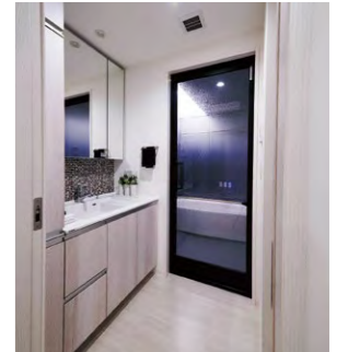
収納建具と同じ扉柄で統一された洗面室とリネン庫