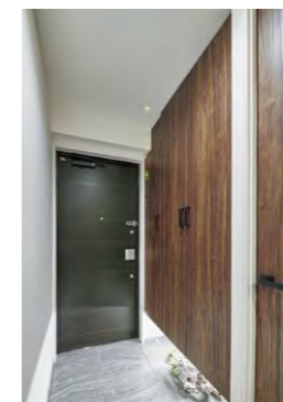
木の質感により落ち着いた感じのある玄関を演出