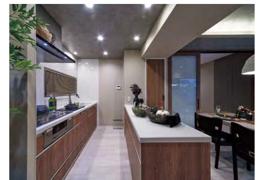
キッチンに自動水栓を標準装備