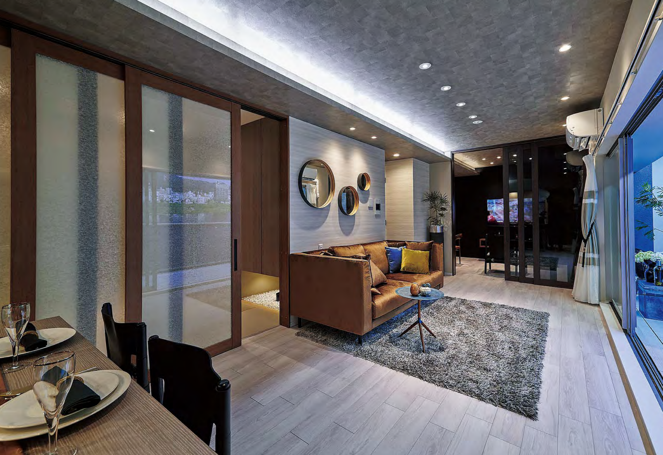
間仕切りのペリテイスプラスによる透過光の質感を活かした開放的なリビング・ダイニング