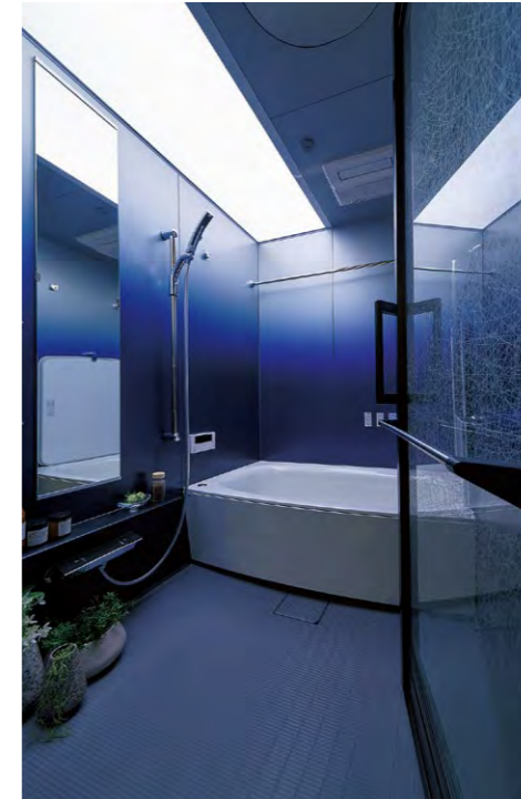
光のイメージと壁が調和する空間「i-X INTEGRAL」

所在地 広島市東区牛田新町 施工主 株式会社良和ハウス 設計・監理 株式会社アートライフ 施工 三栄建設株式会社 構造 鉄筋コンクリート造 地上11階 総戸数 47戸 竣工 2019年12月