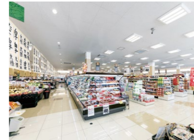
3灯用照明器具を用いたスーパーマーケット

所在地 / 岩手県陸前高田市高田町 事業主 / 高田松原商業開発協同組合 他 運営 / 高田松原商業開発協同組合 他 基本計画 / 株式会社ジオ・アカマツ 施設設計 / 株式会社INA新建築研究所 施工 / 長谷川・高惣特定建設工事共同企業体 他 オープン / 2017年4月