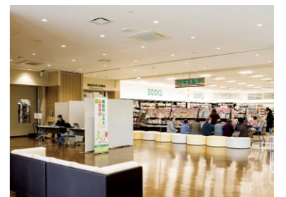
住民サービスなども行われるパブリックスペース