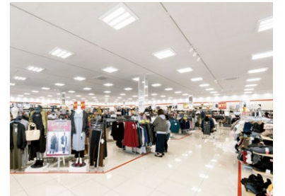
スクエアベースライトが採用されたアパレルショップ