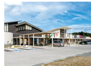
併設されている市立図書館(左)