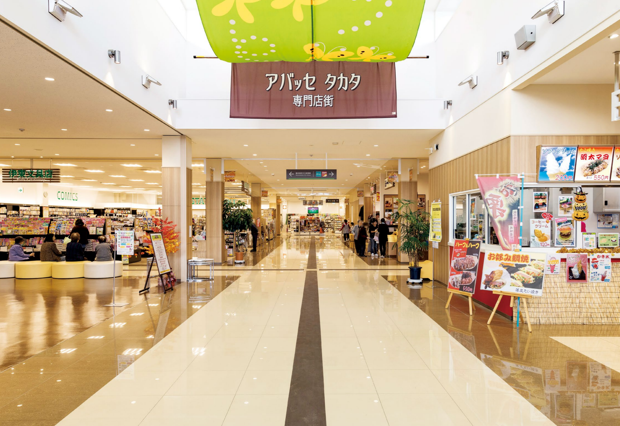
地元の中小企業者による14店舗が入居する「アバッセタカタ専門店街」