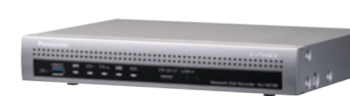
WJ-NX100/05 WJ-NX100/1 WJ-NX100/2

PoE 給電機能付きポート搭載、HDMI モニター出力対応のコンパクトレコーダー。