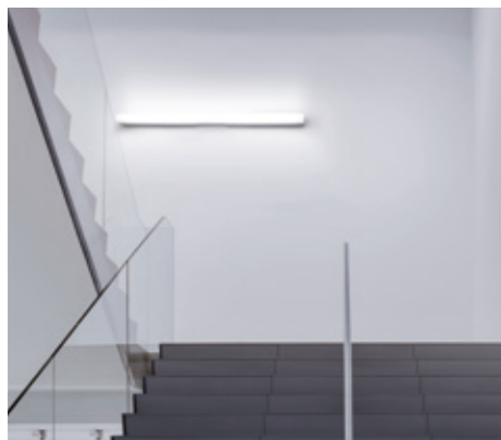
施工イメージ写真