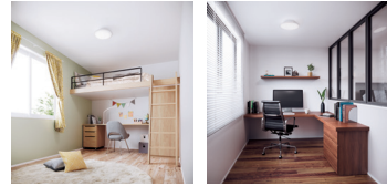
設置イメージ 設置イメージ