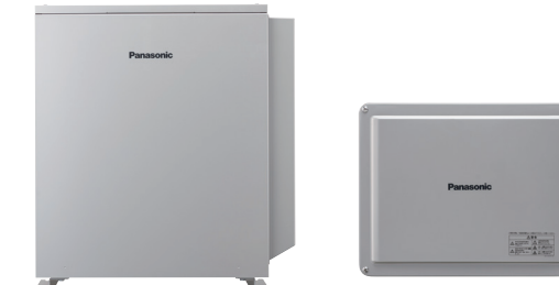
一般仕様 LJB2256 耐塩害仕様 LJB3256 蓄電池用コンバータ 一般仕様 LJDC201 耐塩害仕様 LJDC202