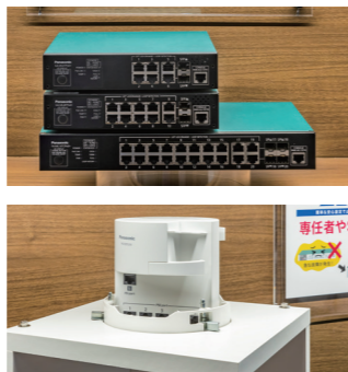
PoEスイッチングハブ GA-ML/FA-MLシリーズ