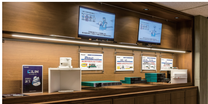
スイッチングハブ展示コーナー