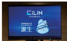
天井埋込型PoEスイッチングハブ「CiLIN」