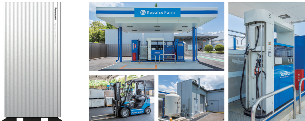
純水素型燃料電池 5kWタイプ 草津拠点構内で稼働中の水素ステーション「H 2 Kusatsu Farm」。左下は燃料電池フォークリフト

パナソニック株式会社 エレクトリックワークス社 スマートエネルギーシステム事業部 水素事業推進室 事業企画課