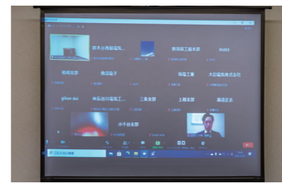
オンライン開催の様子 本部では委員会と事務局のメンバーのみが参加。組合員様は各支部または本社にて視聴されました。