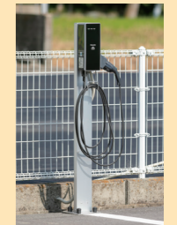
電気自動車充電設備 エルシーヴ+Dポール