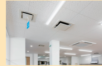
空調三連携(左から天井埋込形ジアイーノ・ 全熱交換器・ビル用マルチエアコン)