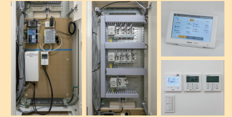
エマネージ・多回路エネルギーモニター