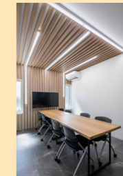
LEDベースライト sBシリーズ