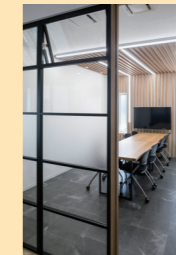
ペリティスしきり窓