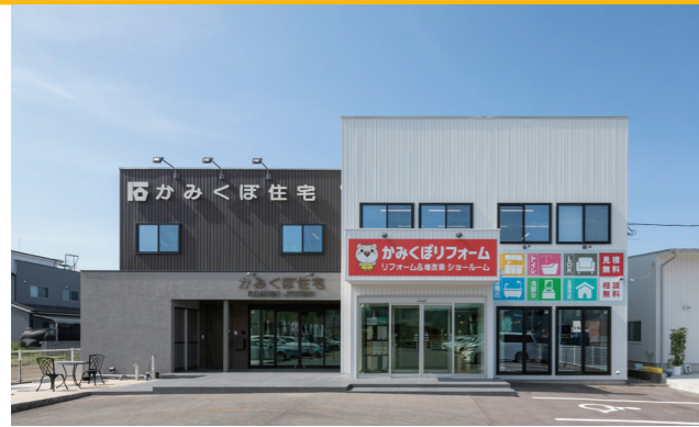
かみくぼ住宅様 本社事務所兼ショールーム