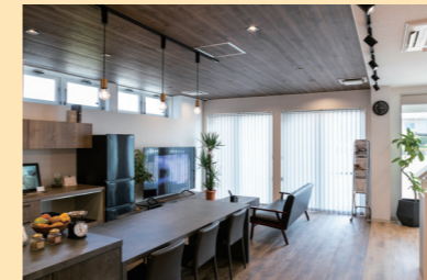
LEDペンダント・LEDスポットライト