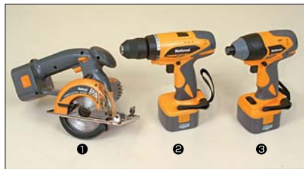
【電動工具】①充電パワーカッター ②充電ドリルドライバー ③充電インパクトドライバー