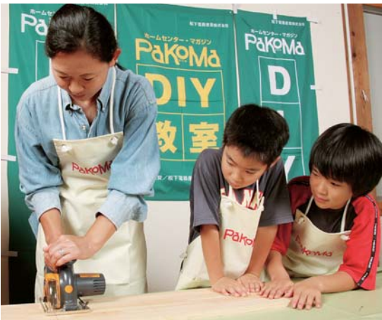
初めて使うパワーカッターにお母さんはちょっと緊張。その手元を見つめる子ども達。

この2種類のドライバーも、ご夫妻ともすぐに使いこなして、初めてとは思えないほど。どちらも、スイッチを入れるとネジ元を照らすライトが点灯して、手元が見やすいニューモデルに、みんなびっくりに！鈴木さんご夫妻の息びつたりの協力ぶりに、おさま応援団のパワーアップで、組み立て作業は快調に進みます。