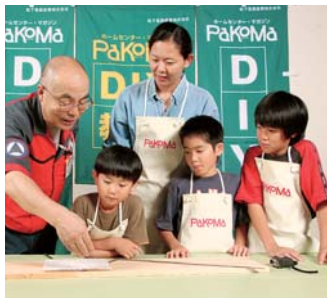
さあ、まず木のカットをするところから始めよう。

「最初はちょっと不安な感じがしましたが、実際に使ってみると案外カンタンなんです。女性の手にも持