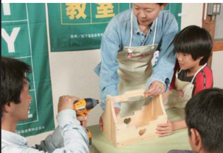
お父さんが持ち手を取り付けたら組み立ては完成。

「最初はちょっと不安な感じがしましたが、実際に使ってみると案外カンタンなんです。女性の手にも持