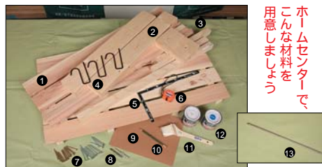
【木材・用具】 杉スノコ(2枚) 2×4材 エゾマツ角材 ハンギング用フック カネジャク メジャー 木ネジ(65mm, 55mm) ドライバビット(下穴あけ用、プラス) サンドペーパー 鉛筆 ハケ 塗料/水性多用塗(ホワイト、スカイブルー) ロングビット(プラス)