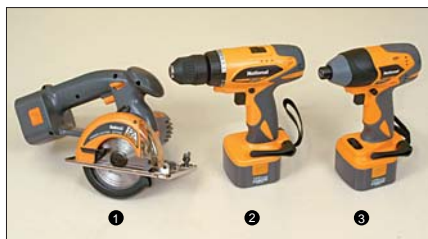
【電動工具】 充電パワーカッター 充電ドリルドライバー 充電インパクトドライバー

ベンチの背板には、フックをかけてハンギングもできるおしゃれな花飾り台。(作り方は次ページ)