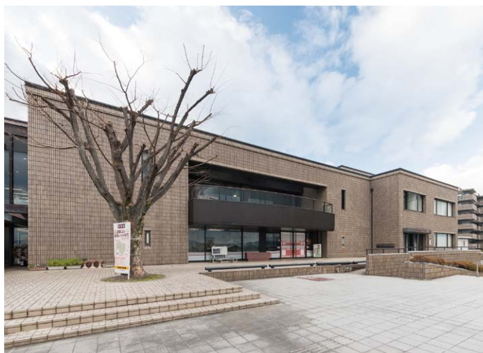
向日市文化資料館・外観

照明には、ワークショップの発表会などでのイベント使用も考慮され、美術館・博物館向け「シューティングスポットライト」が採用されました。iOS端末を用いたリモコン操作で、シューティング(照射方向・配光角度・明るさの調整)が簡単にできるので、高い天井の空間でも安全に操作ができ、また異なる空間利用にも短時間でフレキシブルに対応できるなど、高い導入効果を実感していただいています。