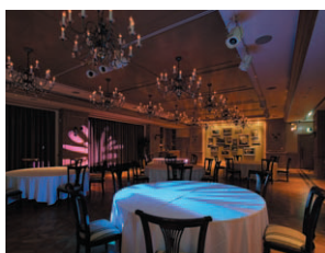
レセプションホール コツツウォルズ

施主／大阪府市町村職員共済組合 様 名称／シティプラザ大阪 (大阪府市町村職員共済組合新会館) 所在地／大阪府中央区 建築設計／日建設計 様 建築工事／大林組 様 電気工事／きんでん 様 竣工／2006年6月