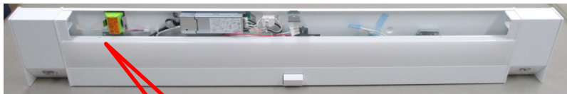
【カバーを外した状態】