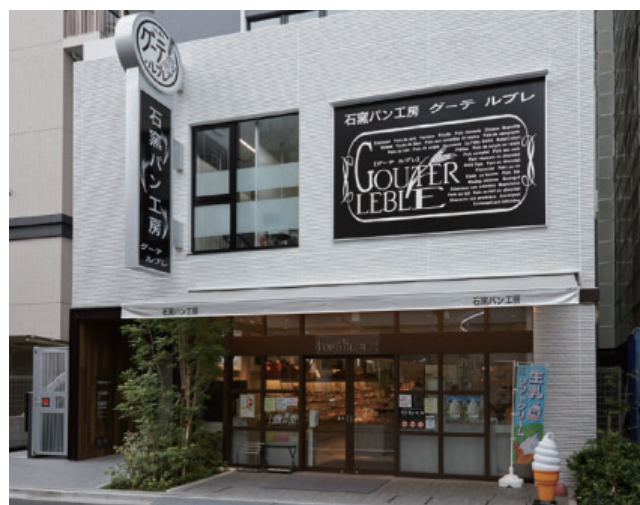
グーテ・ルブレ 入谷店

今回、旧店舗のあるビルが建替えることになったため店舗移転をすることになり、設計事務所と新店舗の計画を検討。照明設備から換気・除菌まで店舗品質にこだわった新しい店舗が完成しました。当社も照明設備をご提案し、トータルにご採用いただきました。