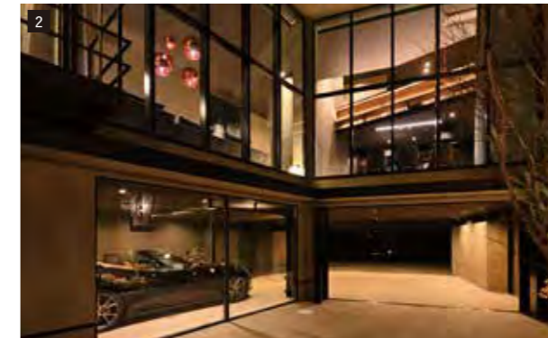
2 大開口 エクステリア 軒下用ダウンライト LEDフラットランプ交換型 美ルック