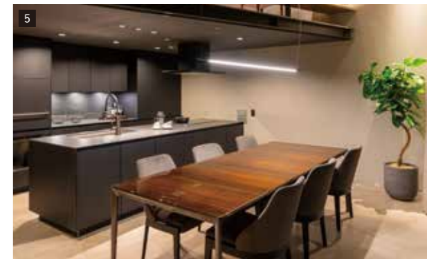
5 2階ダイニングキッチン ベースダウンライト LEDフラットランプ交換型 美ルック