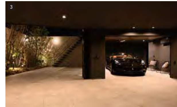
3 インナーガレージ+テラス(光庭兼ガレージ) エクステリア ポーチライト MODULE LIGHT / エクステリア 軒下用ダウンライト LEDフラットランプ交換型 美ルック