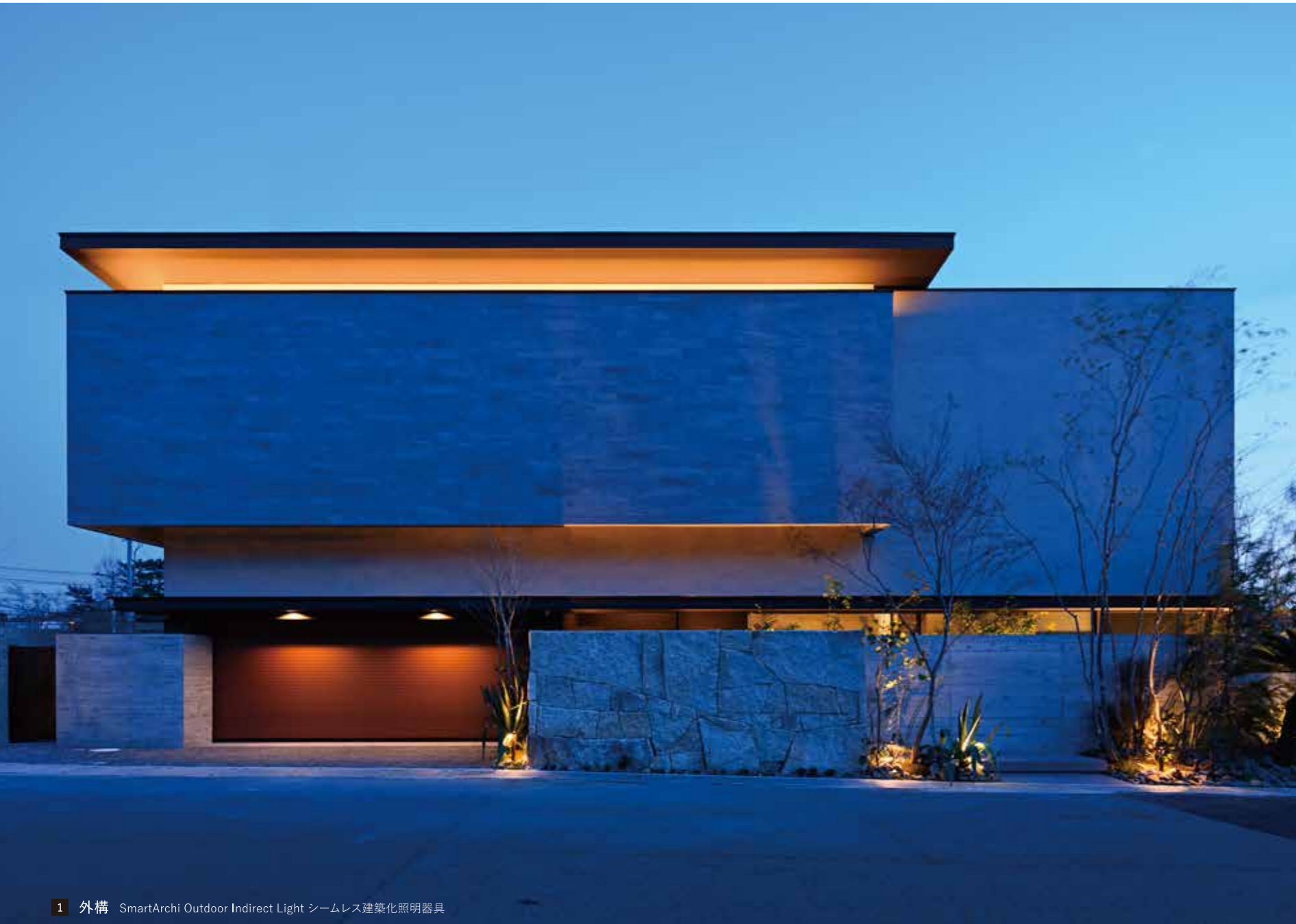
1 外構 SmartArchi Outdoor Indirect Light シームレス建築化照明器具

外観は地域環境と調和させるとともに地域の価値をより高めることを意識し、建物と植栽、自然素材が同化するようデザイン。あかりによって建物を幻想的に浮かび上げさせ、力強さや美しさが最大限に引き立つようにしました。室内は複雑に空間を交差させて立体対角線の視覚的変化を与えることで、プライバシーを守りつつ、開放感の高い住空間の実現を目指しました。あかりはリビング、ダイニング、寝室に調光システムを導入し、気分や過ごし方、時間などに応じて好みの光を自由自在にデザインし、さまざまなシーンをつくり出せるようにしました。