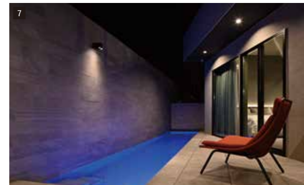
7 寝室側のプール付プライベートテラス