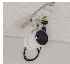
Space Player NTN91000W ○オープン価格