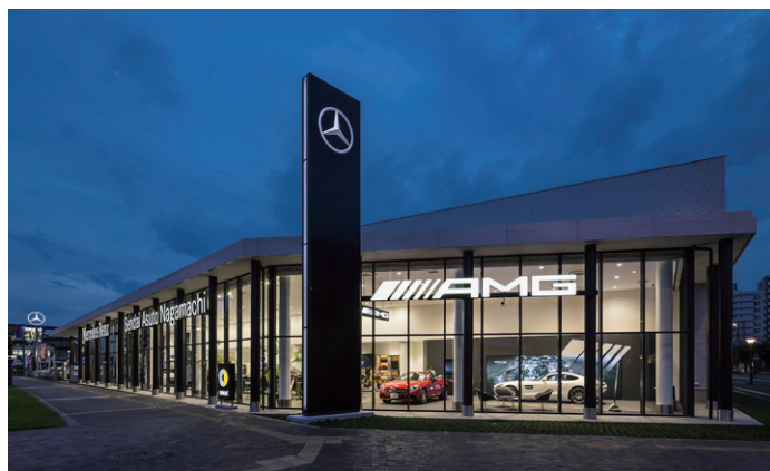
メルセデス・ベンツ仙台あすと長町

新店舗の開業にあたり、認知率アップと販売力強化を図るため、これまでにないインパクトのあるPR手法を検討。映像を活用したPRメディアとして、当社のスペースプレーヤーをご採用いただきました。