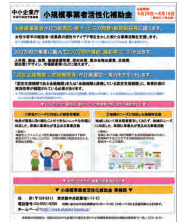
店舗へのキッチン設置のために活用した補助金制度。

補助金で店舗にキッチンを設置し、料理教室の案内はがきを作り、料理の専門家、ご近所の主婦の方やパン屋さんに助けをもらいながら料理教室を開催しています。