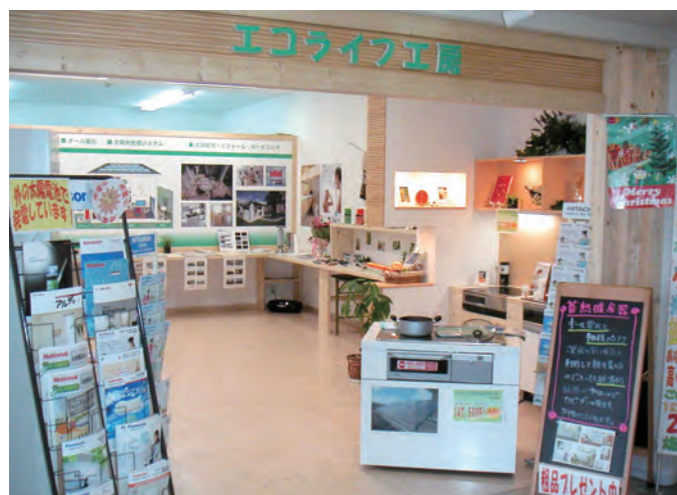
住宅部門として立ち上げた「エコライフ工房」。

省エネや断熱、オール電化などの提案を続けるうちに、次第に太陽光発電の受注件数も増えていきました。しかし、営業マンが定着せず、経理担当の私が営業も兼務することになりました。