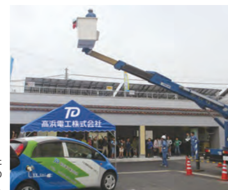
自社敷地内で開催した小学生向けイベントでの高所作業車体験の様子。

電気の仕組みや省エネ、環境保全の大切さを学ぶ座学を行いました。生徒さんたちが一番盛り上がったのが高所作業車体験。安全面に最大限の配慮をしながら実施しました。太陽電池を使った発電実験にも皆さん興味津々でした。