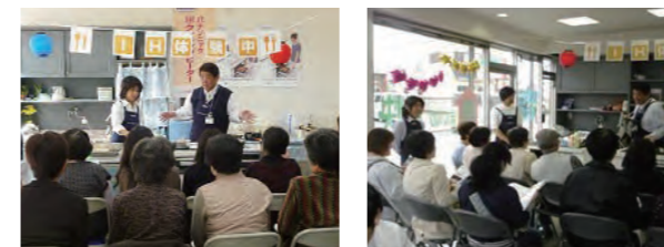
初めて挑戦したIHクッキングヒーター実演会。

早速、自分でホームページを作り、IHの実演イベントを実施。初めてのイベントで集客が不安でしたが、ママ友や知人が知り合いに声をかけてくれたおかげで大盛況でした。次はいつやるの?とお客様の声に背中を押され、年2回程度のイベントを開催するようになりました。