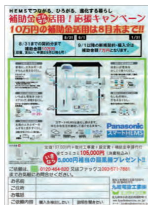
AiSEG販売のために制作したチラシ。

昨年の春先にパナソニックさんからAiSEG販売のお勧めがあり、勉強会を実施。補助金+5000円相当の扇風機プレゼントというキャンペーンを打ち出して社員全員で取り組みました。当初の目標100台を超える実績をあげましたが、その大半が太陽光発電のお客様でした。成功の要因をあげるとすれば、営業活動や施工で築き上げたお客様との信頼関係だったように思います。