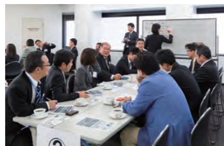
和気藹々の雰囲気ながら、ビジネスに直結する情報交換が行われました。

主婦視点営業などの女性の戦力化や異業種とのアライアンス、OB顧客への継続訪問による接点強化など、具体的な日常活動の手法、問題点を情報共有できる有意義な時間となりました。