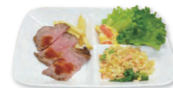
IH実演会で実際に作ったローストビーフ。

IH実演会も毎回同じような内容だと魅力が薄くなると悩みながらのイベントでした。でも、来場されるお客様と仲良くなり、「見てもらうだけでなく、一緒にお料理をしたい」と思い、お客様からも「自分でもIHを使ってみよう」という声が多くなり、料理教室にチャレンジしようと決心しました。